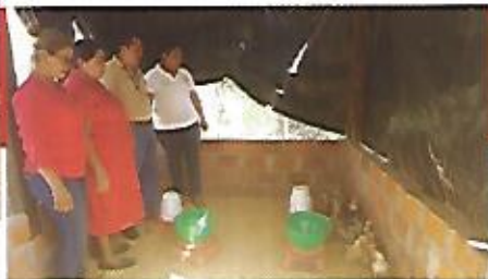
Mujeres beneficiadas con la entrega de pollitas a través de la Asociación de Mujeres de Nejapa.