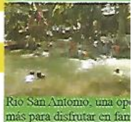
Rio San Antonio. una opción más para disfrutar en familia.