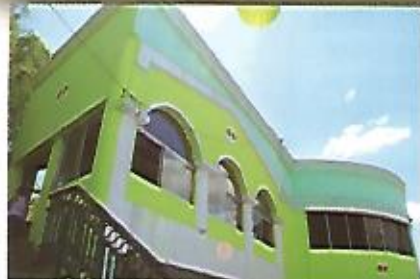
Mejoramiento de Mercado Plaza España.