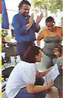
ISIA entrega escrituras familias nejapenses.