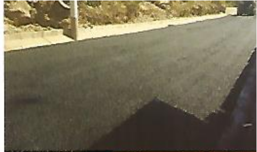
Mejoramiento de calle en Cedral.