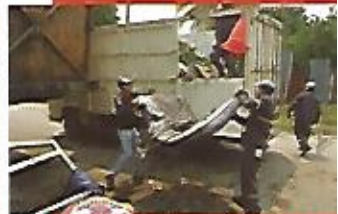
Puesta en marcha del Plan C para la erradicación del zanado. Comisión Municipal de Protección Civil