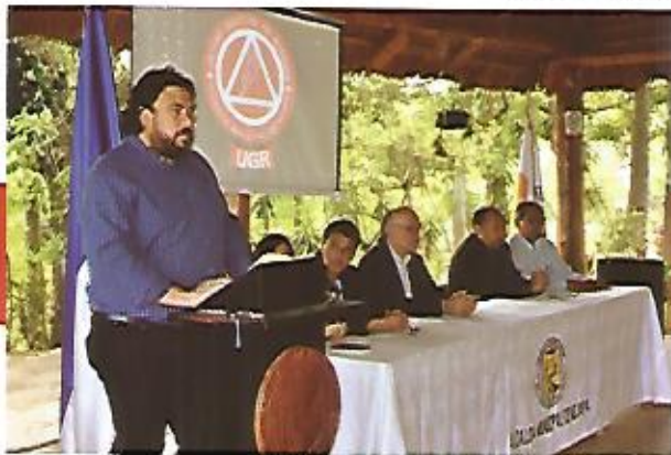
Lanzamiento del proyecto Salud Urbana en el municipio de Nejapa. Ministerio de Salud y Alcaldía de Nejapa.