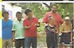
Integración de techos en com. Nuevo Ferrocarril III IJA