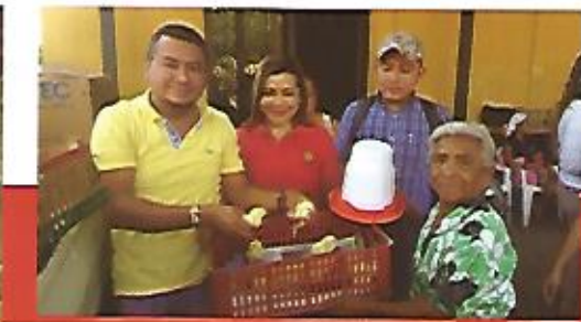
Seguridad alimentaria para nuestra gente.