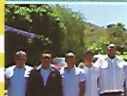
Visita del Vice President Oscar Ortiz al Pohdepor