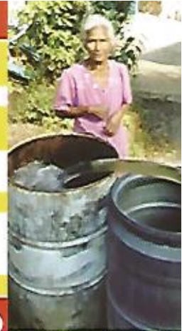
Contribuyendo con pipas de agua potable para cantón San Jerónimo Los Planes.