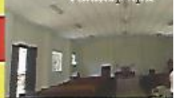
Reconstrucción de iglesia Tutultepeque.