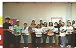
Entrega del Plan Municipal contra la violencia de género