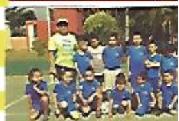
Apoyo para nuestra niñez mediante el deporte, Res. Villa Constitución.