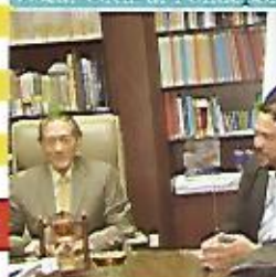
Firma de convenio para apoyar al sector salud