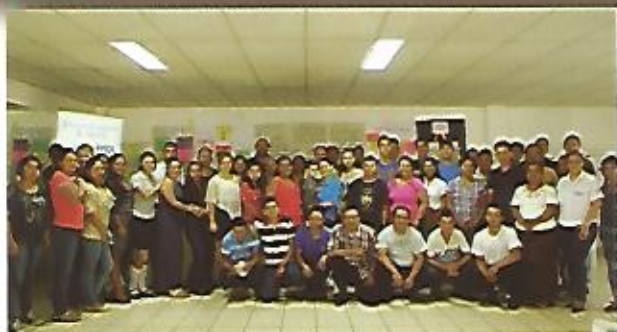
Emprendedores nezapenses beneficiados con el programa PES, impulsado por el Gobierno Central.