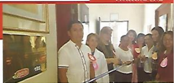
Inauguración de Centro Recolector de Leche Materna, Unidad de Salud y Empresa Privada.