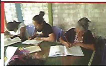
Programa de alfabetización impulsado por el Gobierno Central, beneficiando a cientos de Nejapenses.