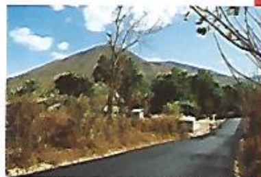
Asfaltado de calle en comunidad I.a Portada