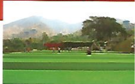
Remodelación de cancha de fútbol rápido "Barcelona".