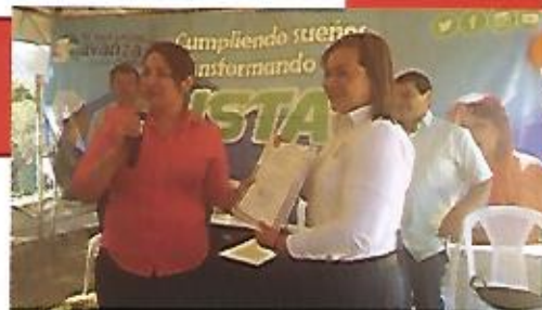
Entrega de escrituras de zonas verdes en comunidad El Cedral.