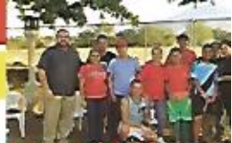
Apoyando el deporte, comunidad Nueva Esperanza