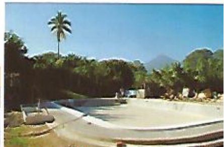
Construcción de piscina para niños y mejoramiento total del complejo Vitoria Gaspar.