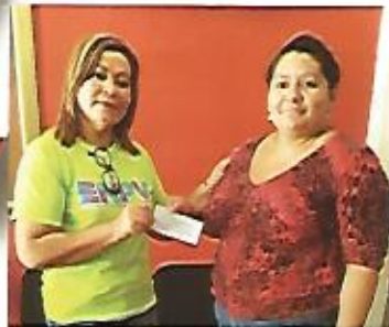
Apoyo para familias de escasos recursos económicos.