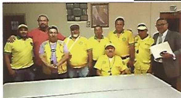
Firma de convenio de cooperación entre Alcaldía Municipal y Comandos de Salvamento, Nejapa.