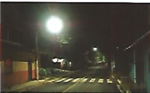
Instalación de 650 luminarias LED en el municipio de Nejapa.