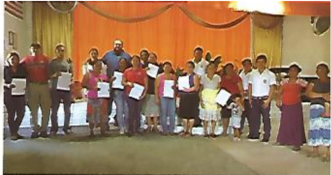
Personas beneficiadas con la entrega de escrituras para normalización de terrenos, colonia Ferrocarril.