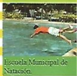
Escuela Municipal de Natación.