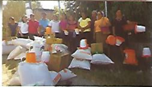
Proyecto de seguridad alimentaria para apoyar a las familias nejapenses, Unidad de la Mujer.