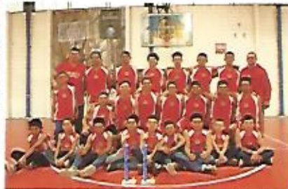
Apoyo para nuestros jóvenes mediante el deporte.