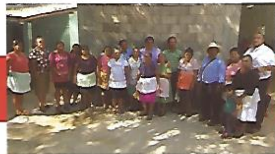
Reconstrucción de iglesia Jesús de Nazareno, en cantón Tutultepeque.