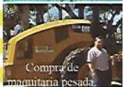
Compra de maquinaria pesada.