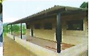
Suministro y colocación de piso de la casa comunal del caserío Las Vegas.