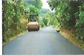
Pavimentación con concreto asfáltico de calle El Castaño, cantón El Conacaste.

Nejapa parte de ti: Potenciaremos a los jóvenes talentos que pongan en alto el nombre de Nejapa en las áreas del deporte, arte, cultura y estudio, a fin de garantizarles un mejor futuro, libre de violencia.