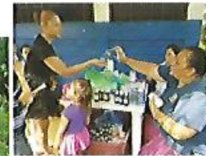
Jornadas médicas gratuitas.