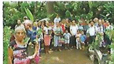
Programa Salud Urbana, beneficiando a adultos mayores y primera infancia.