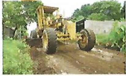
Reparación de calle en colonia El Cambio y mantenimiento de caminos vecinales.

Nejapa transitable: Ampliaremos el acceso y la conexión de las comunidades rurales del municipio de Nejapa, por medio del mantenimiento preventivo y correctivo de calles y construcción de obras de paso.