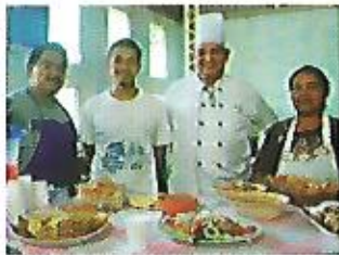
Taller de cocina y panadería Programa Emprendedurismo Solidario FISDL - Alcaldía