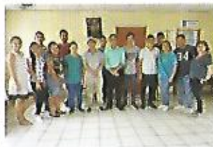
Programa de becas.