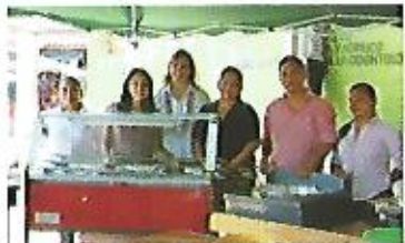
Entrega de capital semilla Programa Emprendedurismo Solidario FISDL - Alcaldía.