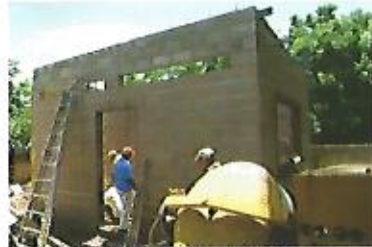
Construcción de baños para parvularia en Centro Escolar Caserío La Granja.