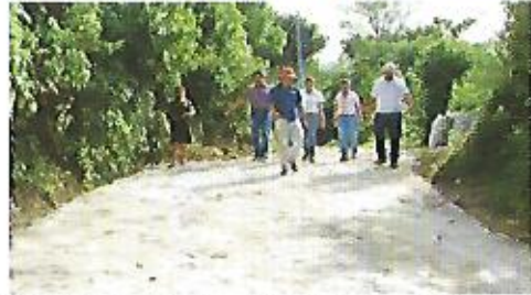
Donación de materiales para la construcción de empedrado fraguado de calle primera etapa, San Jerónimo Los Planes.