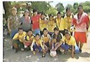
Donación de uniformes y apoyo a torneos locales.