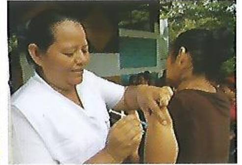
Jornadas de vacunación, odontología, vacunación y capacitaciones acerca de los derechos de las mujeres.

Nejapa saludable: Acercaremos los servicios de salud integral complementaria, a las poblaciones de comunidades rurales y urbanas de Nejapa, mediante la promoción de espacios saludables, incluyendo la prevención.