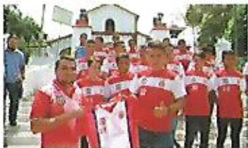
Apoyo a nuestro equipo de Tercera División.