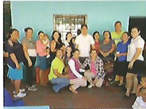
Creación de doce comités de mujeres en distintas comunidades de Nejapa, beneficiando a no menos de nueve sectores.

Nejapa mujer. Crear oportunidades para una vida con dignidad de las mujeres del sector urbano y de las comunidades rurales de Nejapa, a través de capacitación técnica e iniciativas económicas familiares.