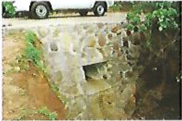
Reconstrucción de muro de retención para paso peatonal y vehicular, caserío Barba Rubia.