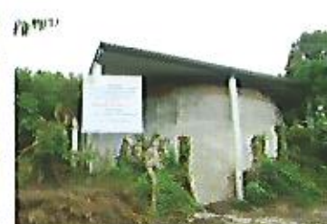
Reconstrucción de la estructura y cubierta de techo del tanque de almacenamiento de aguas lluvias, caserío Ramírez, San Jerónimo Los Planes.