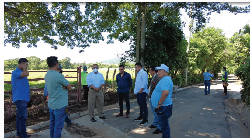
Reparación de calle de acceso a Col. Cuesta Blanca.