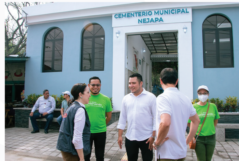
Remodelación de Oficina Administrativa, Sendero y Señaléticas del Cementerio Municipal de Nejapa