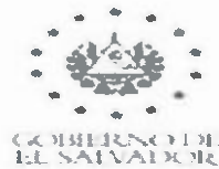
José Agustín Zelaya Velásquez Alcalde Municipal.