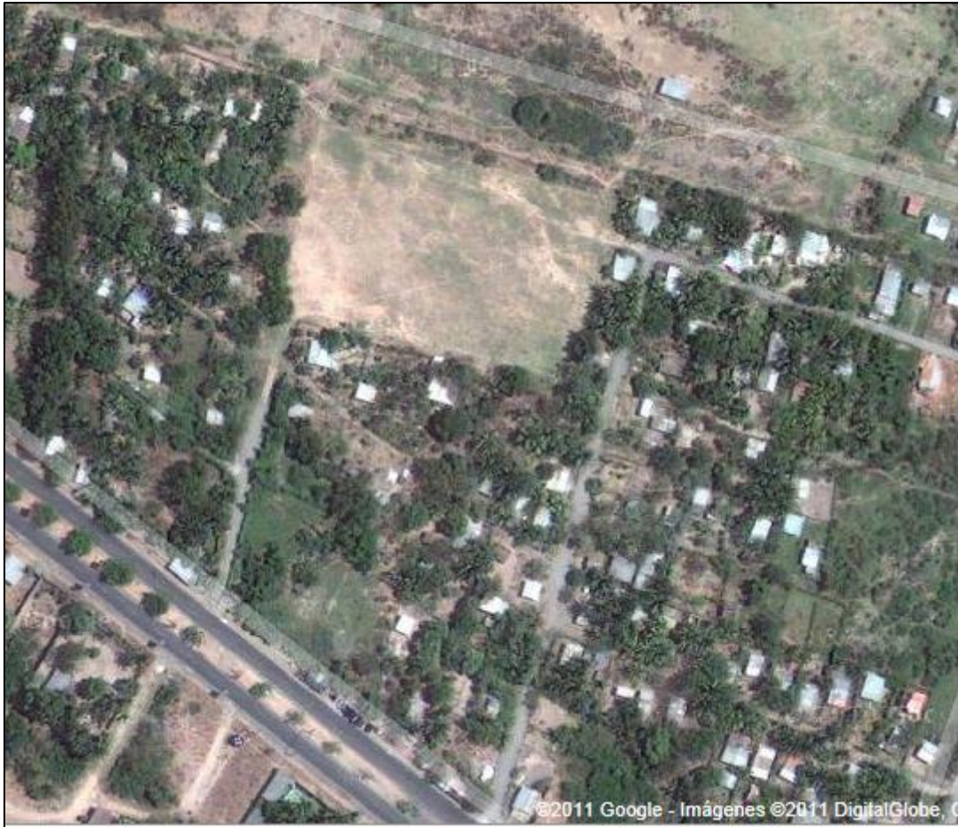
Figura 4: Vista satelital de la comunidad Victorias 2000 en el municipio San Pedro Masahuat,