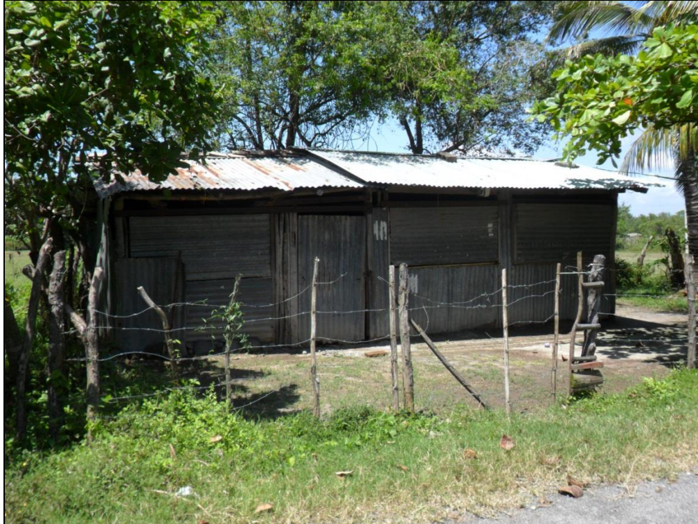
Figura 3: Casa construida con lamina en la comunidad Victorias 2000 del municipio de San Pedro Masahuat.