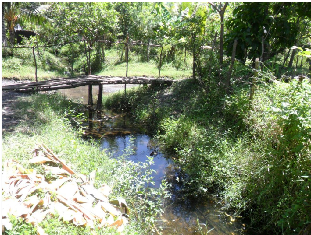
Figura 2: Cañada que en tiempo de invierno colapsan por las fuertes lluvias, en la comunidad Victorias 2000.

La comunidad Las Victorias 2000 ubicada a 13.348859 Latitud Norte y 89.014632 de Longitud Oeste.