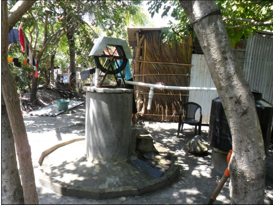
Figura 1: Posos artesanales en la comunidad Victorias 2000.