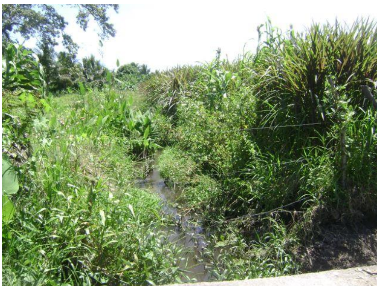
Figura 3: Cañada ubicada al costado Oeste de la comunidad amenaza durante el invierno a la comunidad.