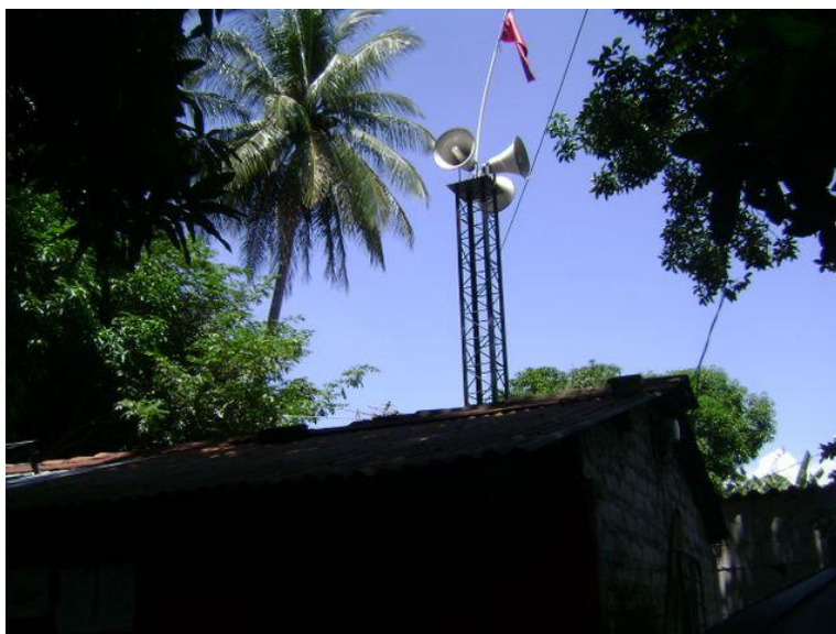
Figura 4: Torre de sistema de alerta temprana ubicada en la casa del coordinador general de la comisión comunal de protección civil.