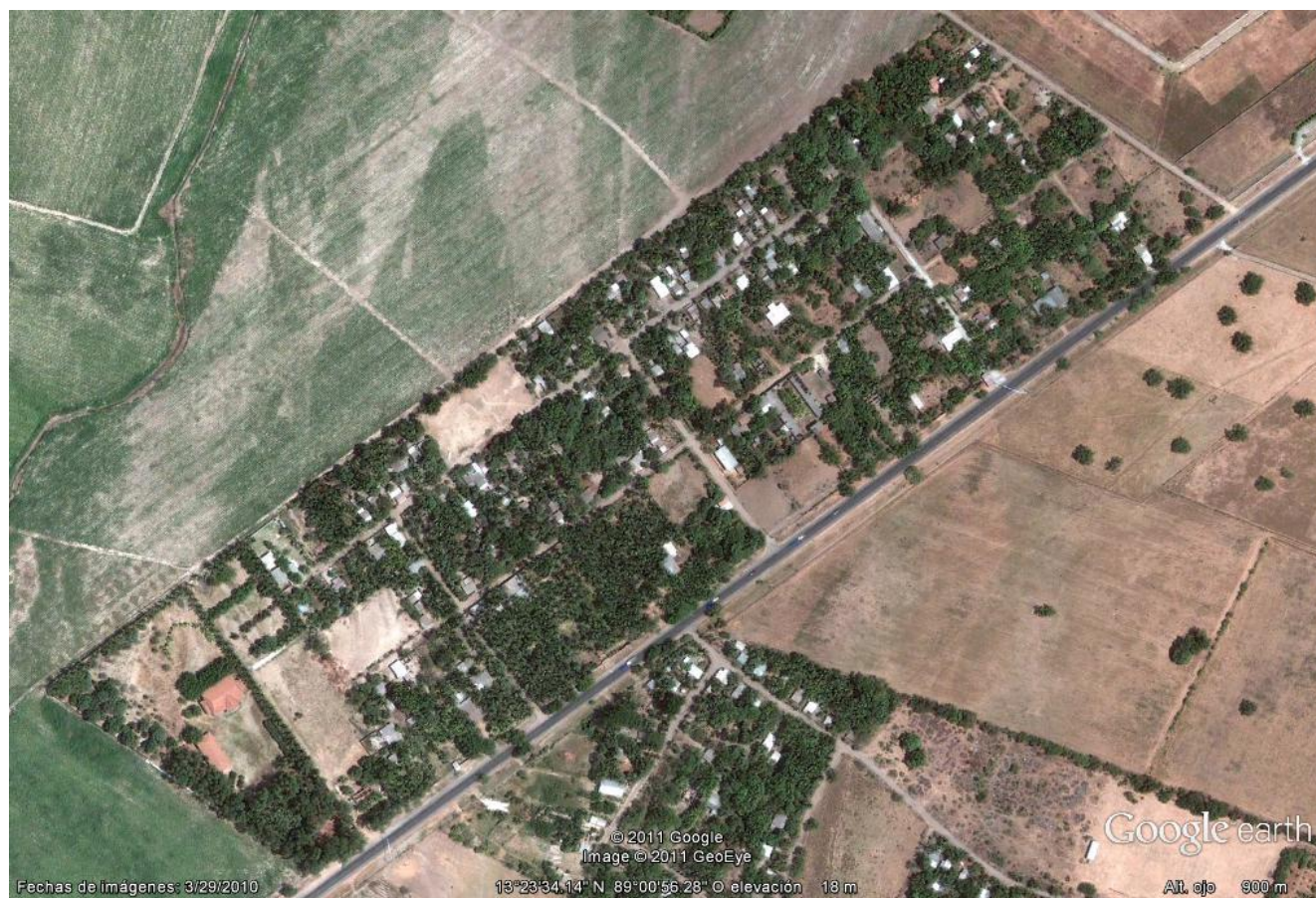
Figura 5: Imagen satelital de la comunidad “El Castaño”