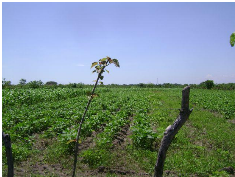
Figura 2: Zonas agrícolas en la comunidad El Castaño