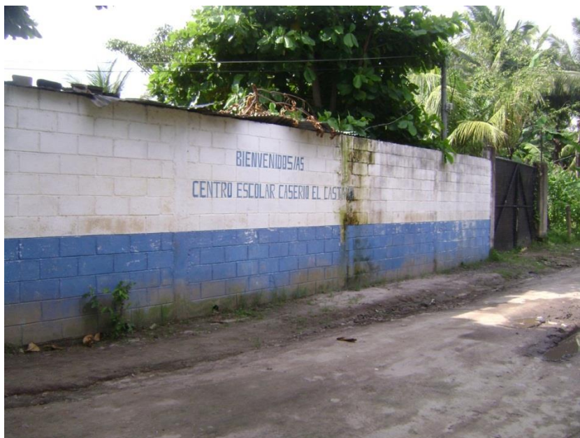
Figura 1: Centro Escolar Caserío El Castaño, al cual asisten la mayoría de los niños y niñas de la comunidad El Castaño.