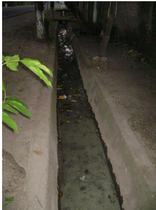
Figura 4: canaleta con agua estancada y contaminada