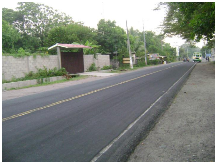
Figura 1: ruta de acceso a la comunidad