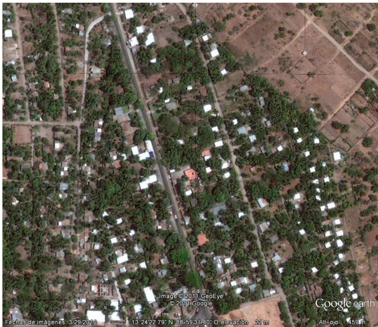
Figura 7: Imagen satelital del cantón San José de Luna