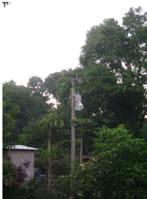
Figura 2: Poste de energía eléctrica en la comunidad