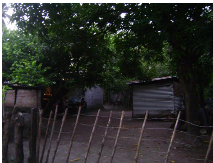
Figura 5: vivienda vulnerable