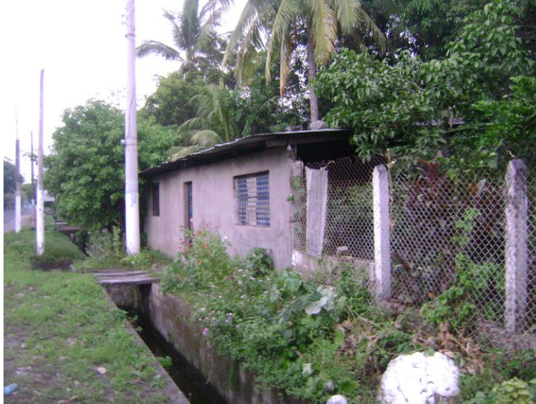
Figura 3: Vivienda de ladrillo y lámina