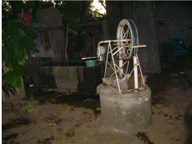
Figura 6: pozo artesanal