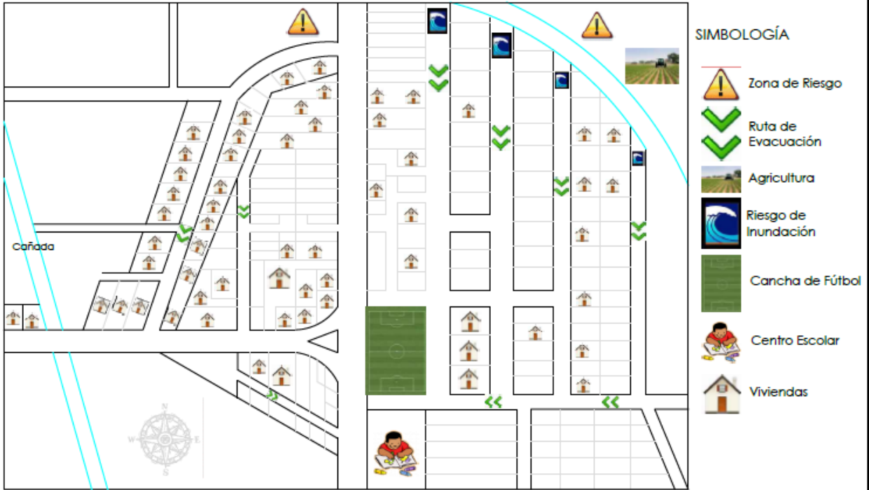
MAPA DE RIESGOS Y RECURSOS DEL CASERÍO DIVINA PROVIDENCIA MUNICIPIO DE SAN PEDRO MASAHUAT