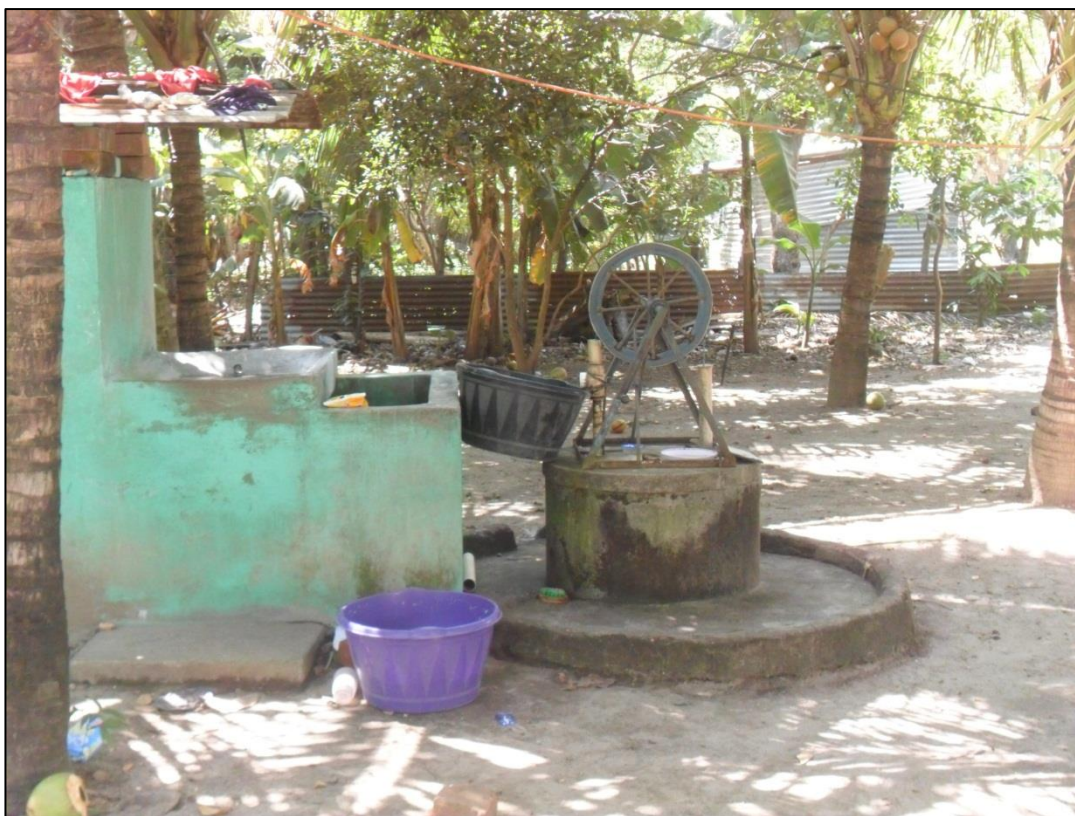
Figura 2: Pozos artesanales en la comunidad Bosque de la Paz La Tequera en San Pedro Masahuat.