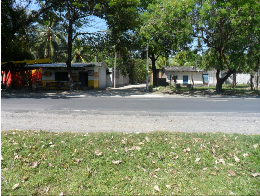
Figura 1: Entrada principal al caserío Bosque de la Paz en el municipio de san Pedro Masahuat.