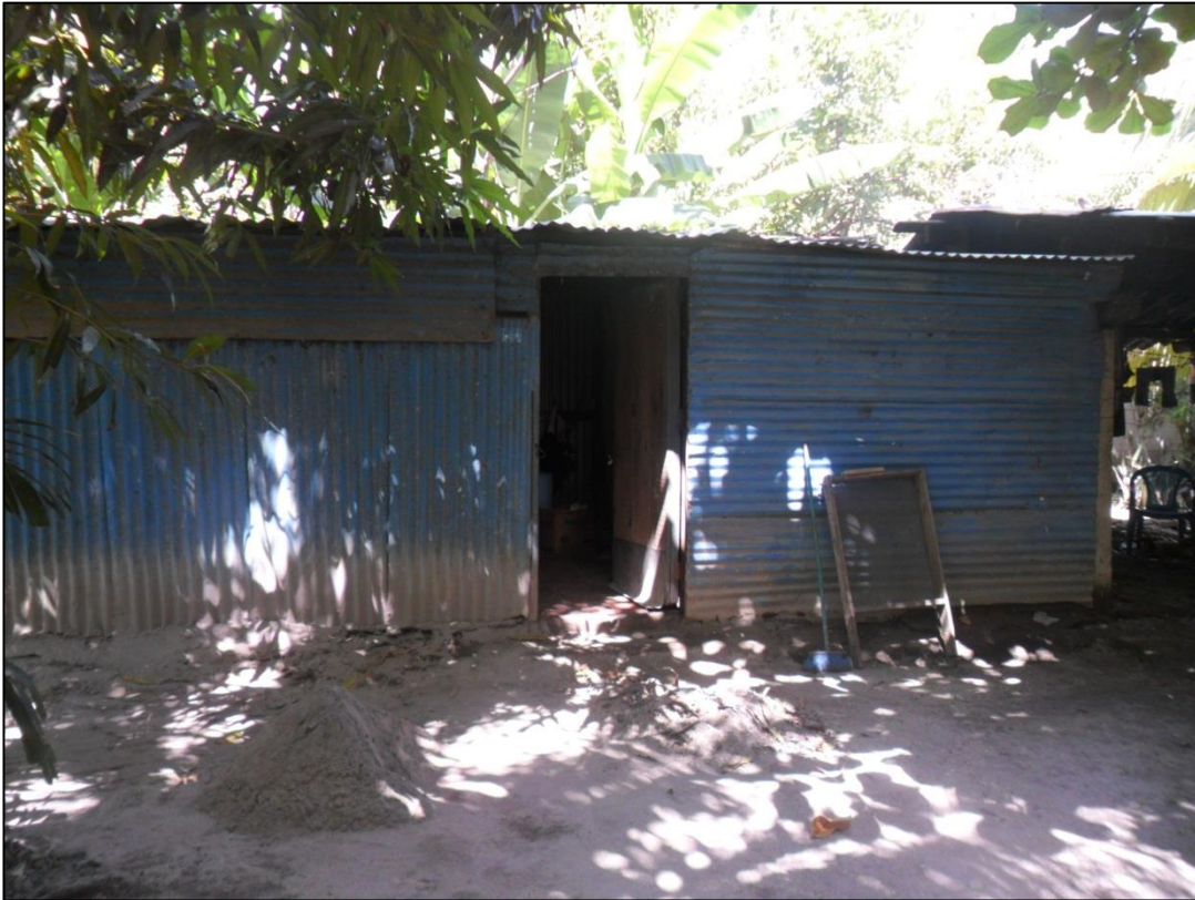
Figura 3: Viviendas de lámina en la comunidad Bosque de la Paz en el municipio de San Pedro Masahuat.