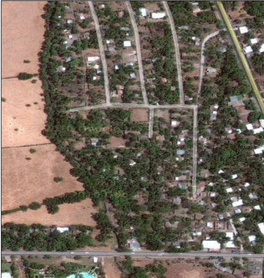
Figura 4: Vista satelital de la comunidad Bosque de la Paz La Tequera en el municipio de San Pedro Masahuat.