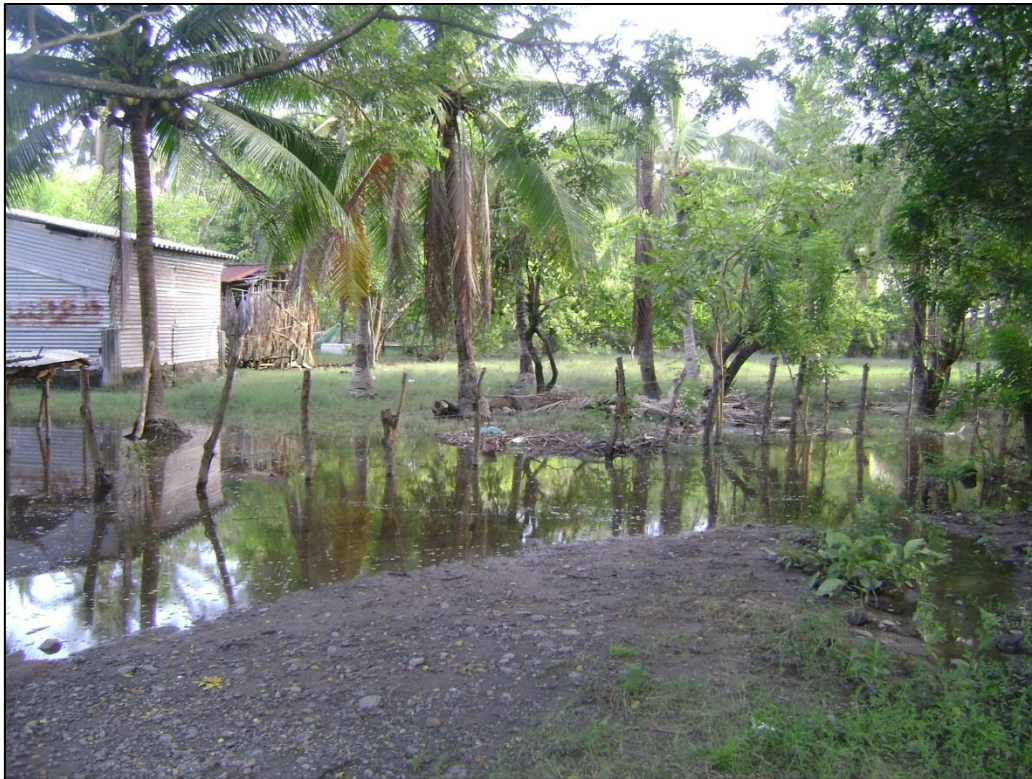
Figura 2: Viviendas en zonas de inundación en el caserío Las Moras en el municipio de San Pedro Masahuat.