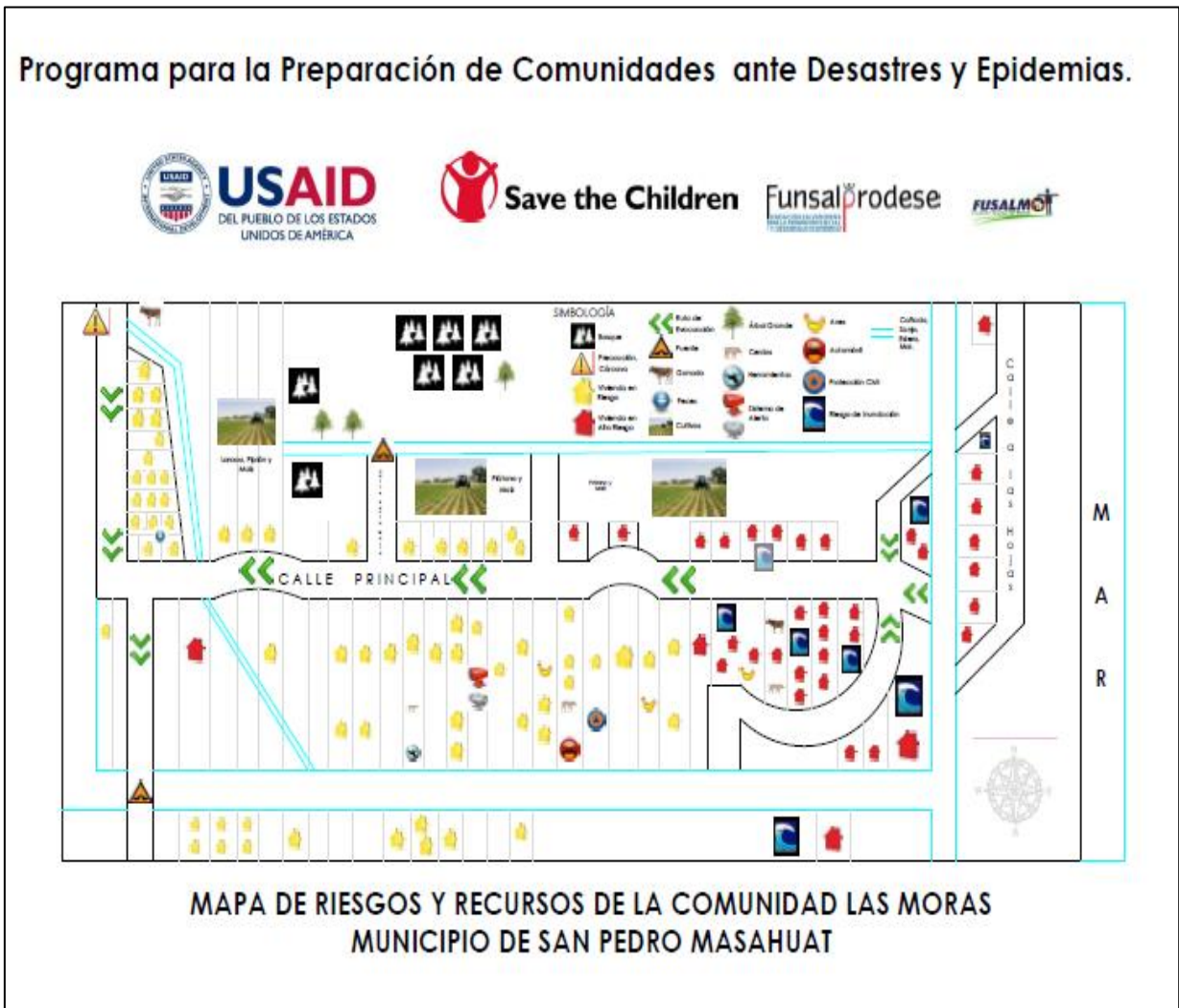
Figura 4: Mapa de Riesgo y Recursos del caserío Las Moras en el municipio de San Pedro Masahuat