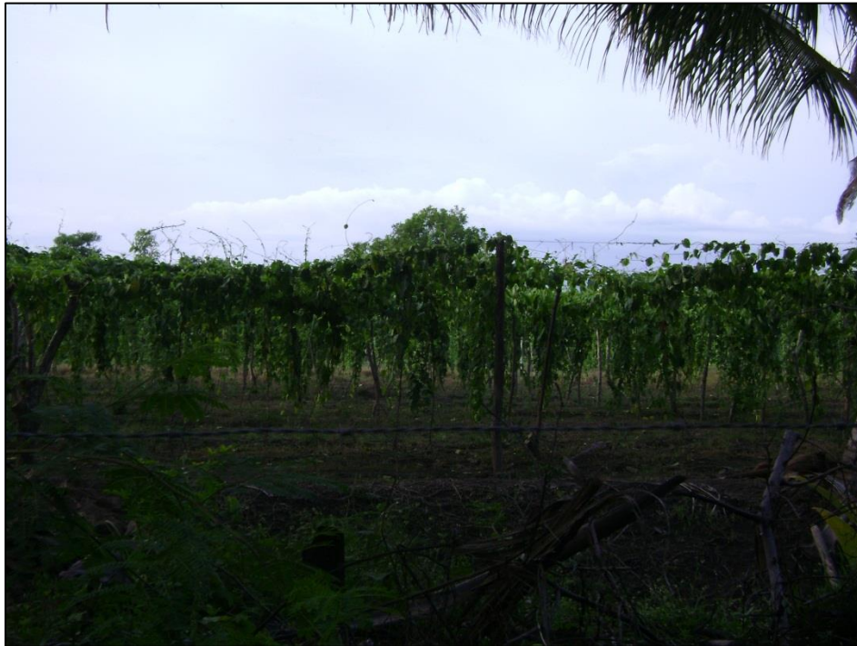
Figura 2: Cultivo de loroco en el caserío Las Moras en el municipio de San Pedro Masahuat.

Las y los habitantes del caserío Las Moras son agricultores y pescadores en pequeño, sus principales cultivos son: maíz, siembra de lorocos, zafra de caña, producción de tilapia. Solo un 6% de la población obtienen sus ingresos de remesas familiares.