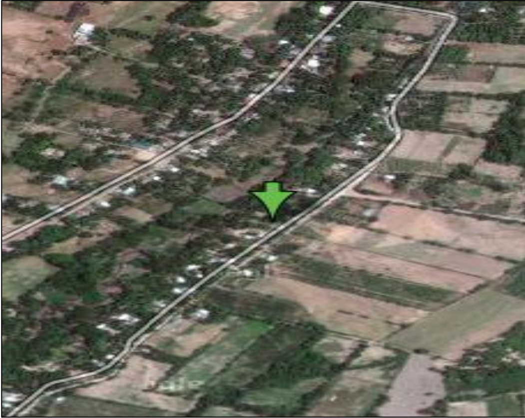
Figura 3: Cultivo de loroco en el caserío Las Moras en el municipio de San Pedro Masahuat