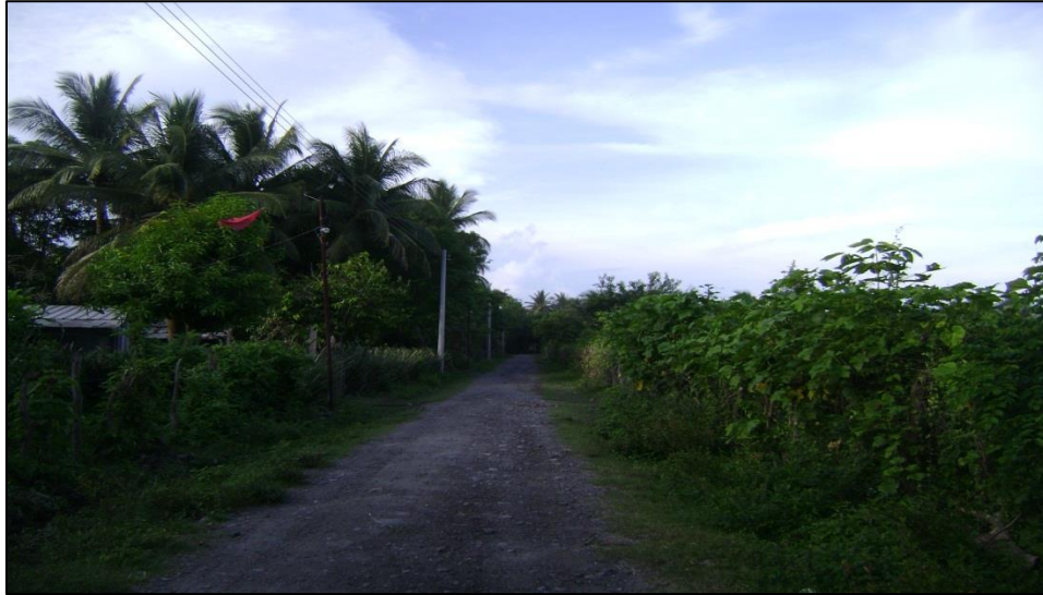
Figura 1: Calle principal del caserío Las Moras en el municipio de San Pedro Masahuat.

Existen tres entradas a la comunidad, la principal inicia desde la comunidad Santa María El Coyol que se encuentra sobre la calle que conduce a la playa Las Hojas aproximadamente a 2 kilómetros, el segundo acceso inicia desde San Marcos Jiboa y el tercer acceso viene del Sur, desde la playa Las Hojas.