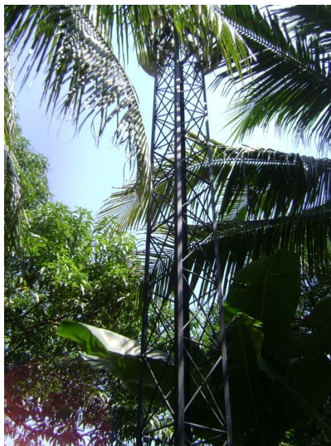
Figura 5: Torre de alerta temprana ubicada en la comunidad.