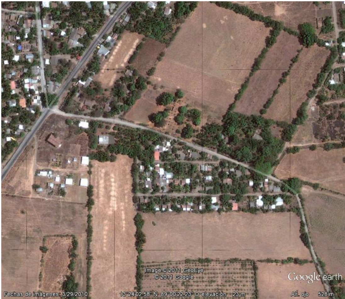
Figura 6: Imagen satelital de la comunidad “Los Ranchos”.