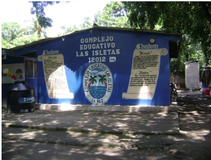
Figura 2: Complejo educativo “Las Isletas”, al cual asisten la mayoría de los niños y niñas de la comunidad “Las Isletas”.