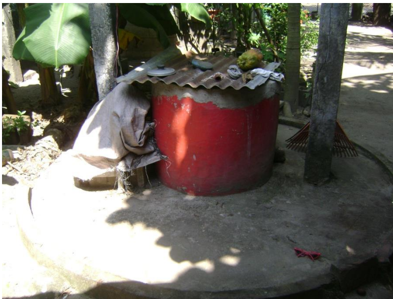
Figura 3: Pozo artesanal ubicado en una vivienda de la comunidad Los Ranchos.