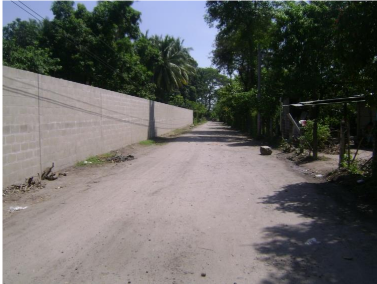
Figura 1: Calle principal de acceso a la comunidad “Los Ranchos” sobre el Kilometro 52, carretera hacia Costa del Sol.