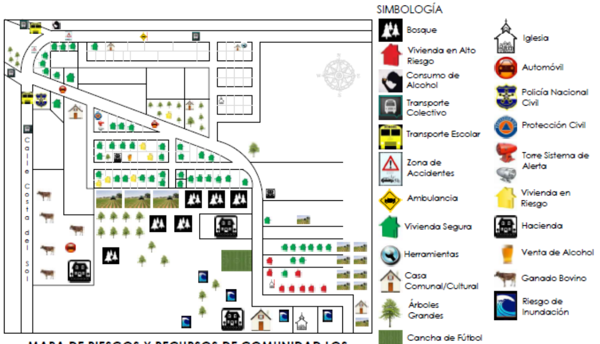
MAPA DE RIESGOS Y RECURSOS DE COMUNIDAD LOS RANCHOS, MUNICIPIO DE SAN PEDRO MASAHUAT