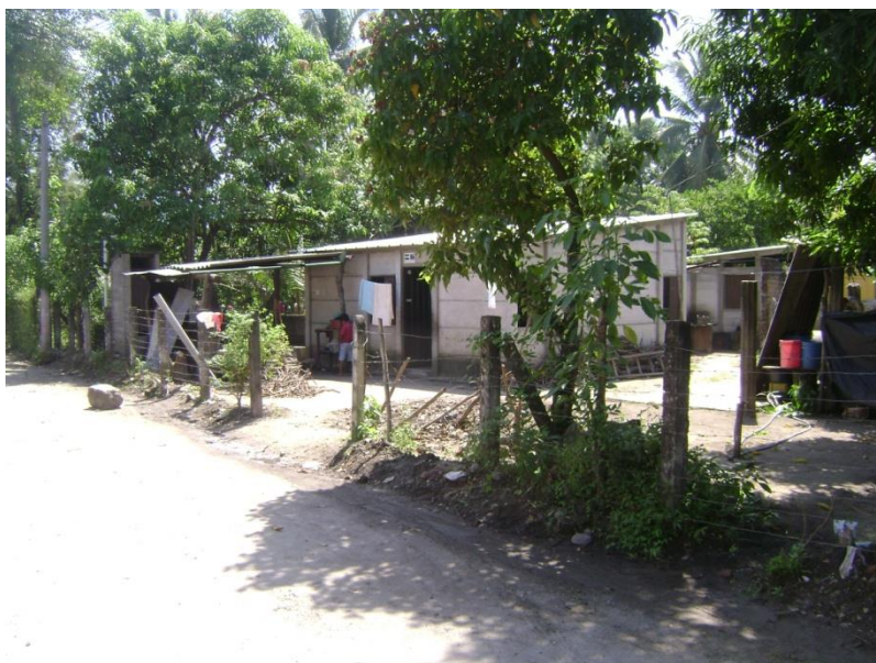
Figura 4: Vivienda prefabricada de cemento construida en proyecto de reconstrucción, comunidad Los Ranchos.