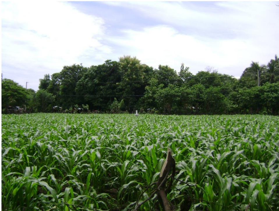
Figura 2: Cultivo de Maíz en Cantón San José de Luna