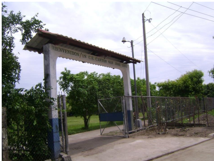
Figura 1: Centro Escolar “Cantón San José de Luna”, al cual asisten los niños y niñas del cantón San José de Luna.