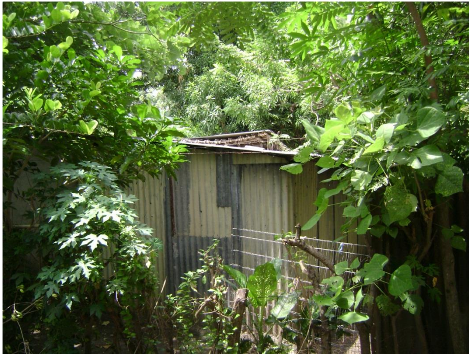
Figura 4: Vivienda identificada como vulnerable ante las amenazas existentes en la comunidad.