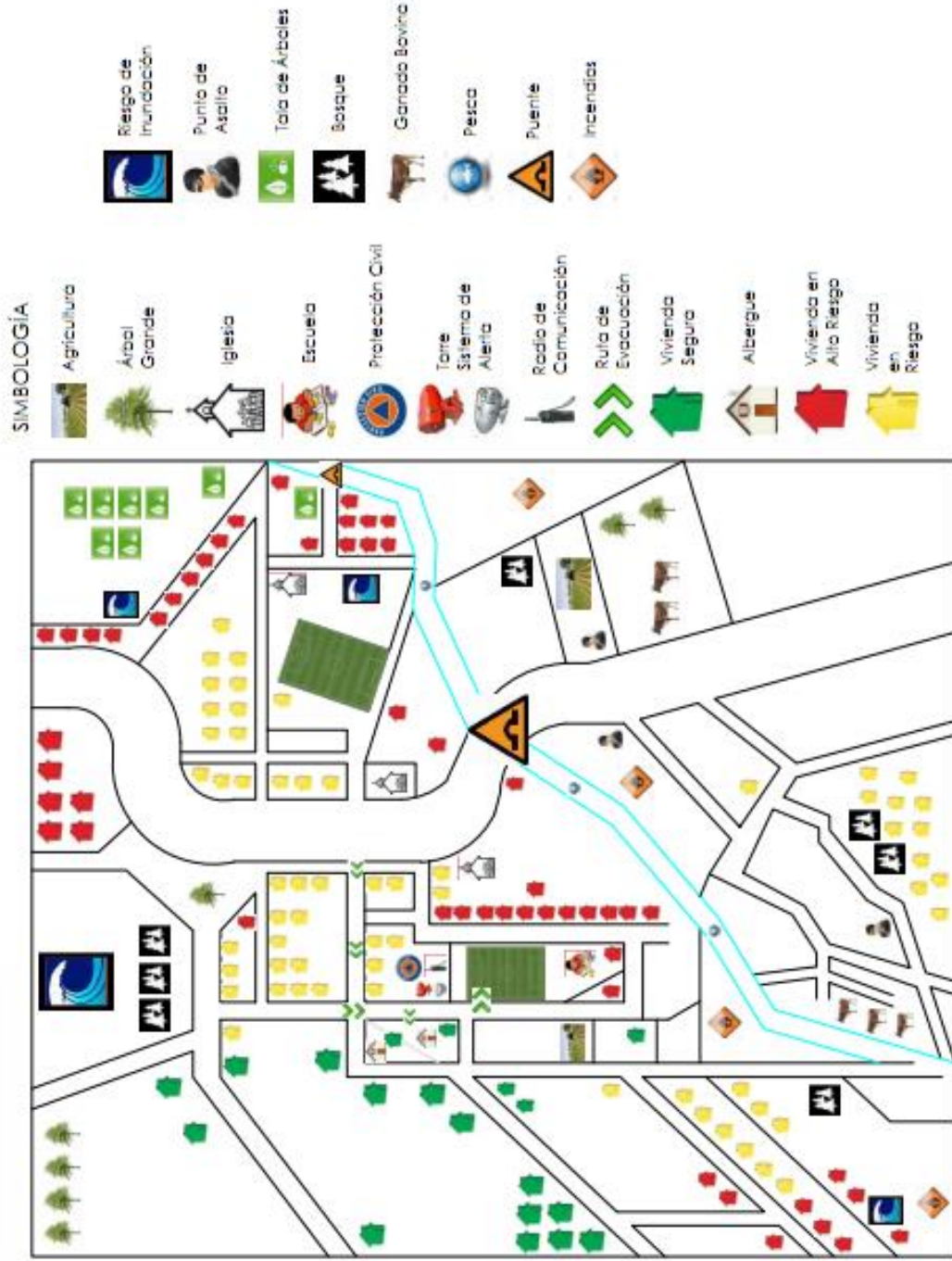
MAPA DE RIESGOS Y RECURSOS DE LA COMUNIDAD SAN JOSÉ DE LUNA, MUNICIPIO DE SAN PEDRO MASAHUAT