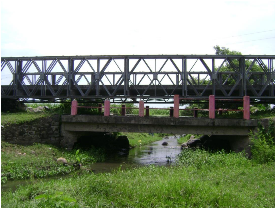
Figura 3: Puente reconstruido luego de la tormenta tropical IDA sobre cañada “San José de Luna”.

La comunidad se encuentra ubicada en un relieve de llanura costera, dada su relativa cercanía a la zona costera de la Paz.