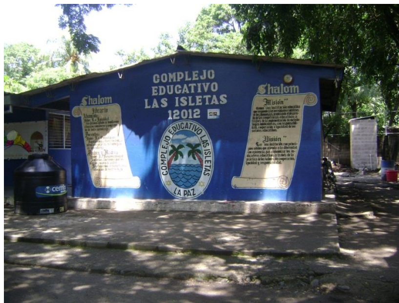
Figura 1: Complejo educativo “Las Isletas”, al cual asisten la mayoría de los niños y niñas de la comunidad “San Marino”.