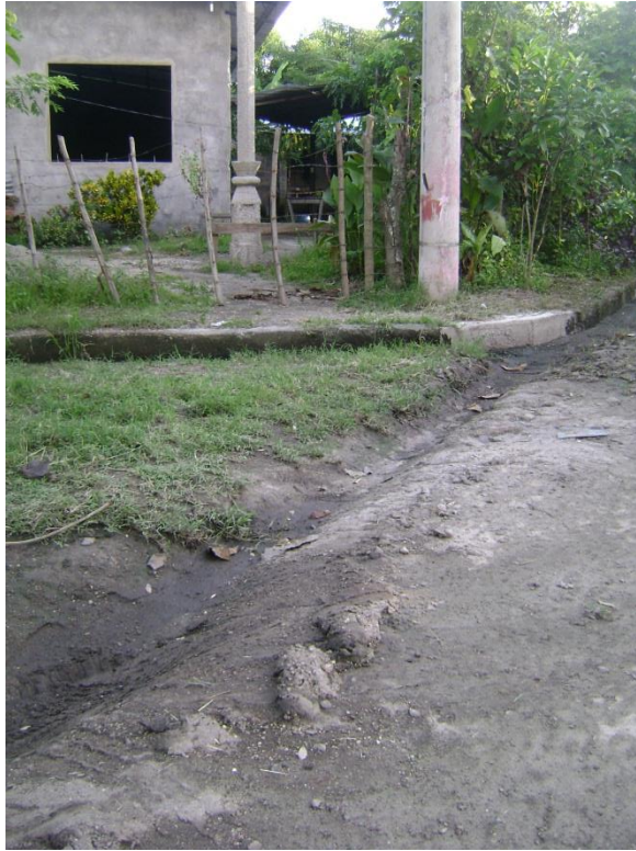
Figura 4: Cunetas de la comunidad provocan acumulación de aguas e inundaciones en inviernos copiosos.