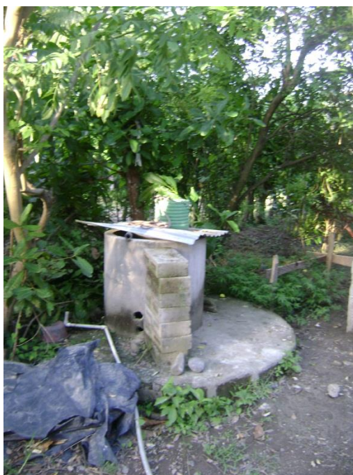
Figura 2: La comunidad San Marino se abastece en un 100% por agua de pozos artesanales.