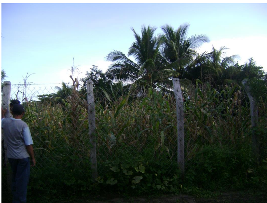
Figura 3: Cultivo de Maíz en la comunidad San Marino.