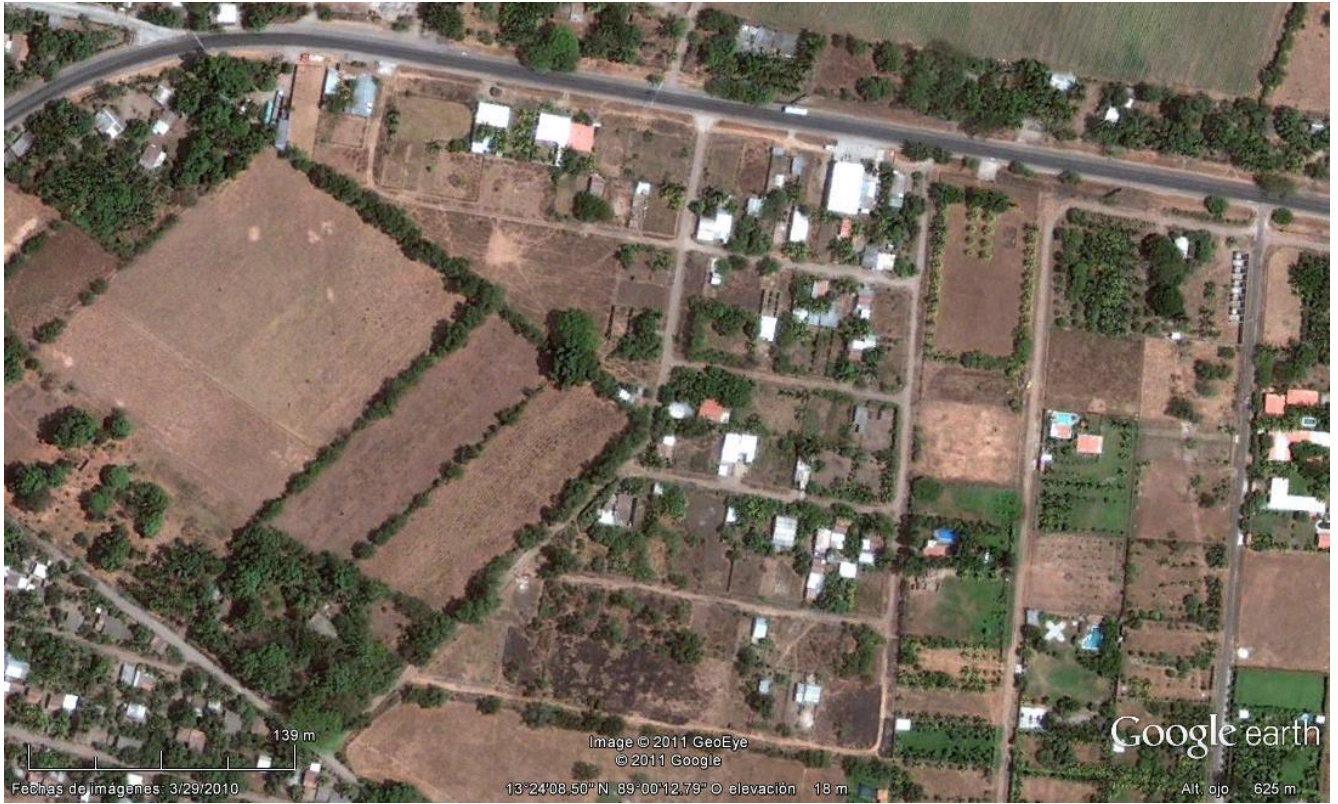
Figura 5: Imagen satelital de la comunidad “San Marino”.