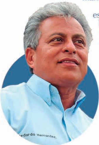
Medardo H. Lara Alcalde Municipal de San Vicente

Esta municipalidad siempre se ha distinguido por ser de puertas abiertas, desde nuestro primer año de gestión y mucho antes de que se implementará la ley de transparencia, ya estábamos rindiendo cuentas a la ciudadanía, de manera que con orgullo estamos celebrando este día nuestra 5ta Audiencia Pública,