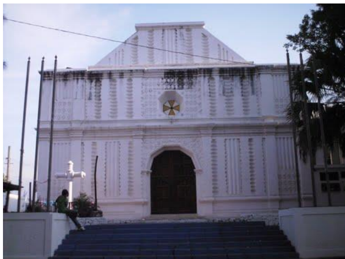
Alcaldía Municipal de san Vicente