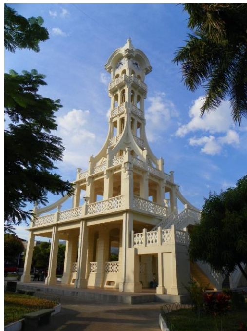
LA TORRE VICENTINA