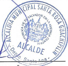
HUGO BESAEEL FLORES MAGAÑA, ALCALDE MUNICIPAL.