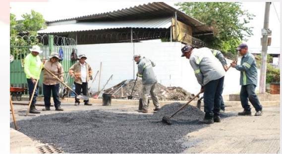
PLAN BACHEO COLONIA LAS MAGNOLIAS