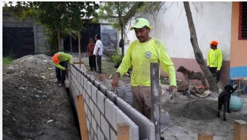
MEJORAMIENTO CASA COMUNAL MONTE BLANCO