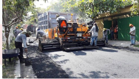
RECARPETEO COL. LOS SANTOS. CALLE SAN LUCAS