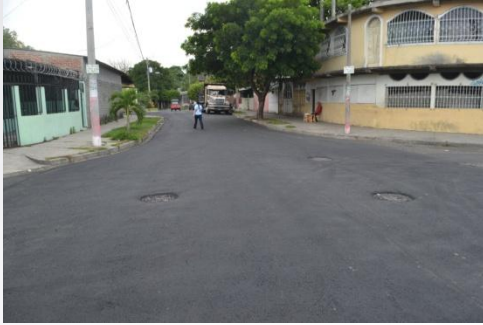
RECARPETEO COL. LAS FLORES