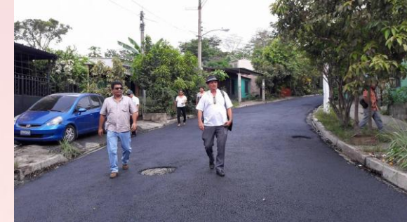
RECARPETEO COL. MONTES V. CALLE PRINCIPAL