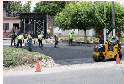
RECARPETEO CALLE PRINCIPAL DE LA COLONIA DIVINA PROVIDENCIA