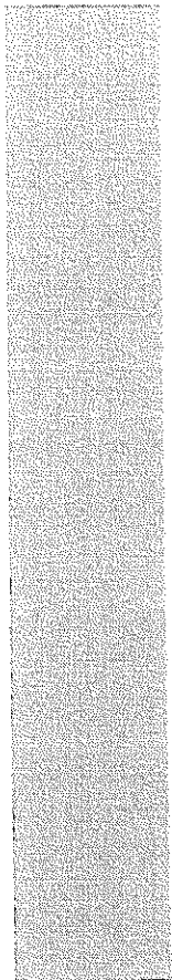
imagen No.1 pasando por Tonacatepeque.

Soyapango está ubicado al oriente del AMSS y a 4,5 km al este de la ciudad de San Salvador. En la imagen n.º 1, se observa que este municipio tiene una posición estratégica con respecto a la Región y al AMSS por su localización en el umbral oriental del AMSS, siendo el tercer municipio de entrada a la ciudad de San Salvador por el costado oriente pasando por San Martín, así como por el norte del AMSS