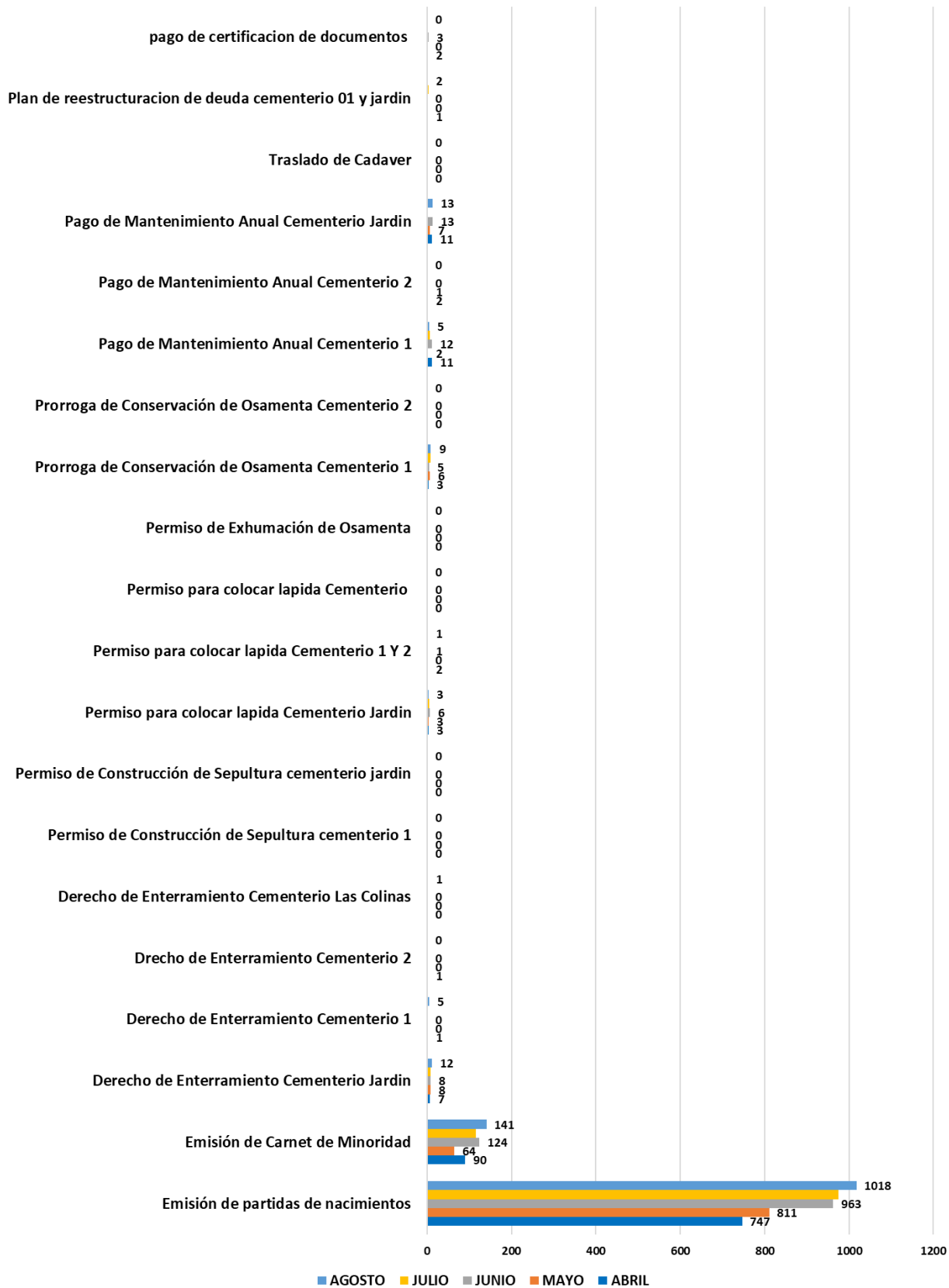
GRAFICO COMPARATIVO DE LOS SERVICIOS PRESTADO DE ABRIL-AGOSTO 2023 EN REGISTRO FAMILIAR