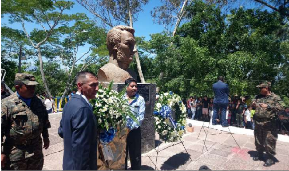
Commemoración del 179º aniversario de el Gral. Francisco Morazán