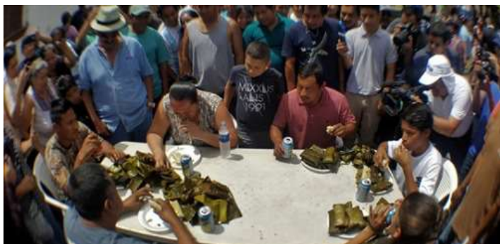
Con la finalidad de promover el turismo y la economía local se desarrolló el "Festival del Tamal"