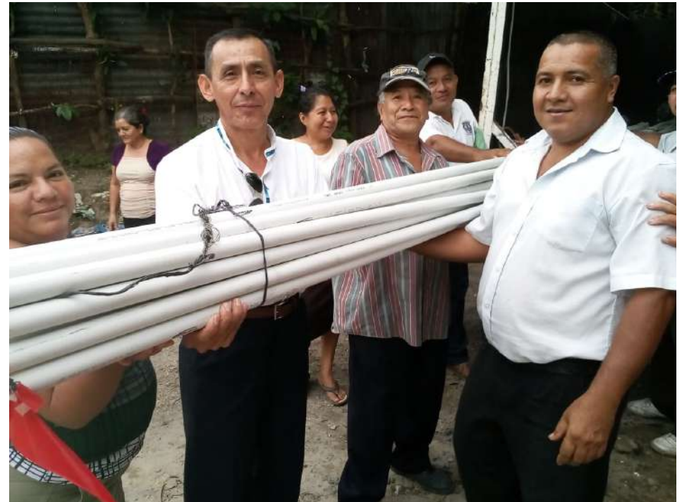
Apoyando introducción de agua potable