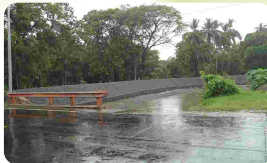
Inversión MAG: $107,000.00

Gestión ante el MAG para construcción de borda en el río Ojushte, obras de mitigación en Escuela La Florida y comunidad Betania I, construcción de tramo de borda en río La Bolsa, desasolvamiento de tramo del río a la altura de Betania I, como Alcaldía en coordinación con las comunidades acompañamos y supervisamos las obras. $285,000.00 (Inversión MAG)