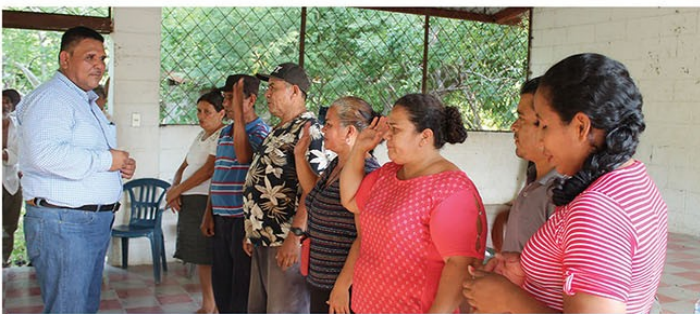
Juramentación de junta Directiva El Socorro

Y es que es necesario recalcar que este fortalecimiento nos permitirá poder identificar los problemas que se dan en las comunidades así como gestionar las soluciones.