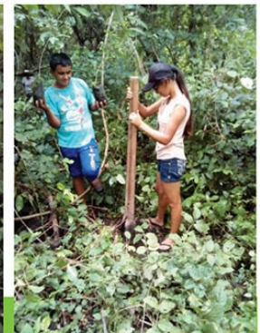
Area de Nacimiento de Agua Com. San Francisco Angulo