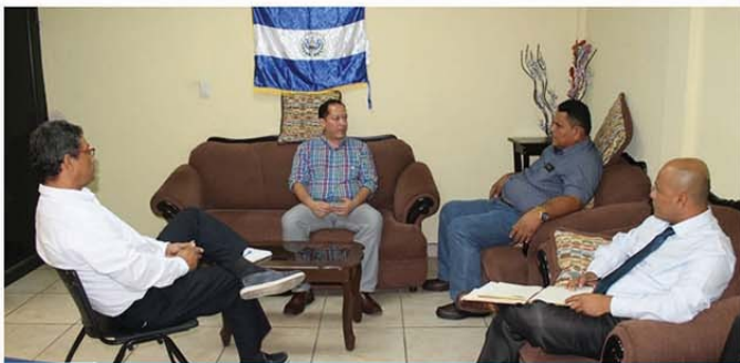
Reunión con representante del Grupo Roca acerca del trabajo de cooperación.

Cabe mencionar que con la intención de continuar trabajando de la mano con la población tecoluquense recibiremos con los brazos abiertos a toda la población e instituciones, amigos de la cooperación internacional y a todo aquel que quiera sumarse a este Concejo y poder avanzar juntos al desarrollo.