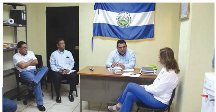
Reunión con la presidencia del FISDL para la ejecución de importantes proyectos de infraestructura