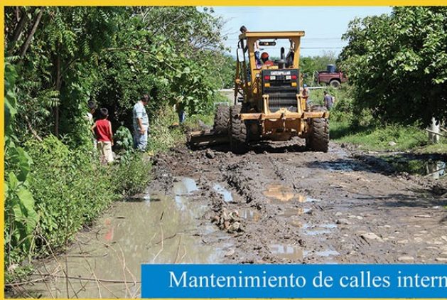
Mantenimiento de calles internas en comunidades de los 7 sectores