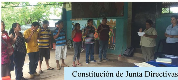
Constitución de Junta Directivas en Comunidad Jardines del Volcán