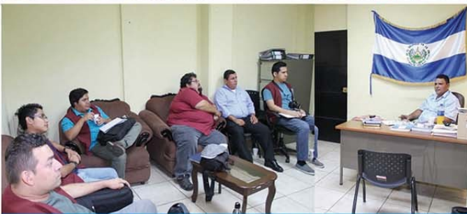
Estudiantes de la Universidad Tecnológica

Desde el inicio de la actual gestión y como una muestra de apertura y concertación ciudadana con personas naturales e instituciones, hemos realizado diferentes reuniones en las cuales se ha conocido acerca del trabajo de cada uno de los actores presentes en nuestro municipio con quienes se ha coordinado con la idea de seguir buscando soluciones a toda la problemática presente en las comunidades.