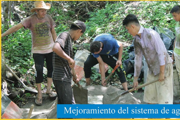
Mejoramiento del sistema de agua potable en comunidad 19 de Junio