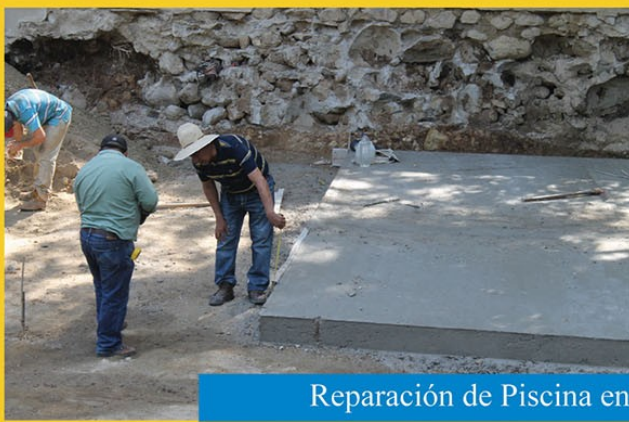
Reparación de Piscina en Parque Ecoturístico Tehuacán