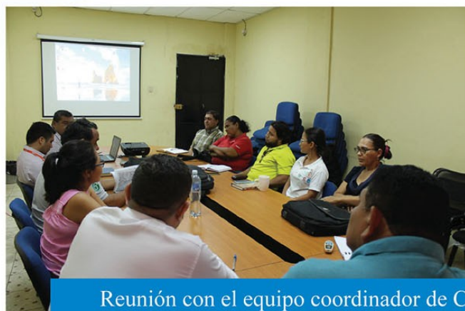
Reunión con el equipo coordinador de CORDES Región San Vicente, para conocer el trabajo y proyectos realizados entre estas ONGS y la Municipalidad de cara a la población