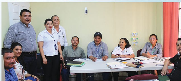
Reunión de planificación, promotores, gerencia, concejales y Alcalde Municipal.