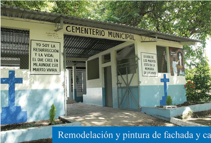
Remodelación y pintura de fachada y capilla del cementerio municipal de Tecoluca