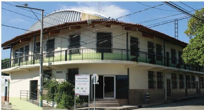
Pintado de instalaciones de Casa Comunal de Tecoluca