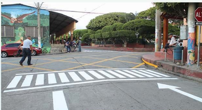
Pintura de calles y avenidas