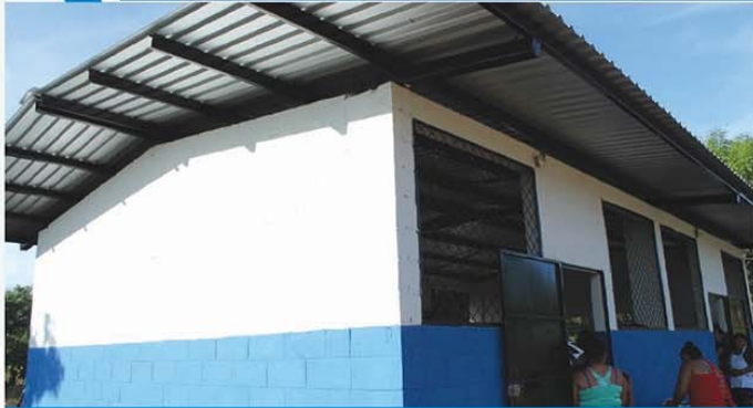
Casa Comunal Las 90 II, Sector Santa Cruz Porrillo