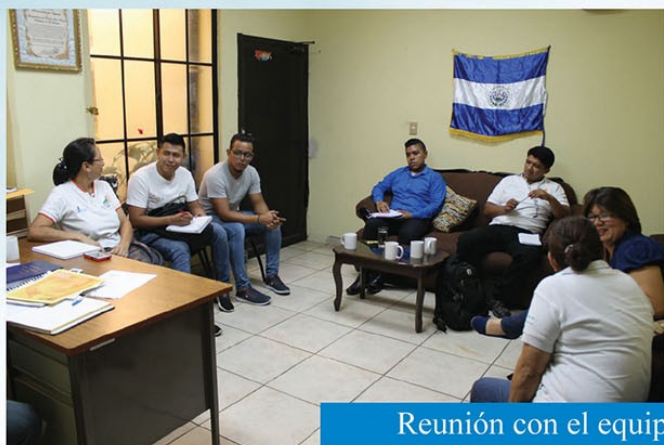
Reunión con el equipo coordinador de CIDEP.

Agradecemos a tres importantes ONG en nuestro Municipio, éstas son CIDEP, CORDES y CRIPDES con quienes durante el presente año se realizaron diferentes reuniones de acercamiento con el propósito de continuar con los convenios de cooperación y beneficiar a las comunidades de nuestro municio.