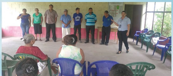
Juramentación de juntas Directivas