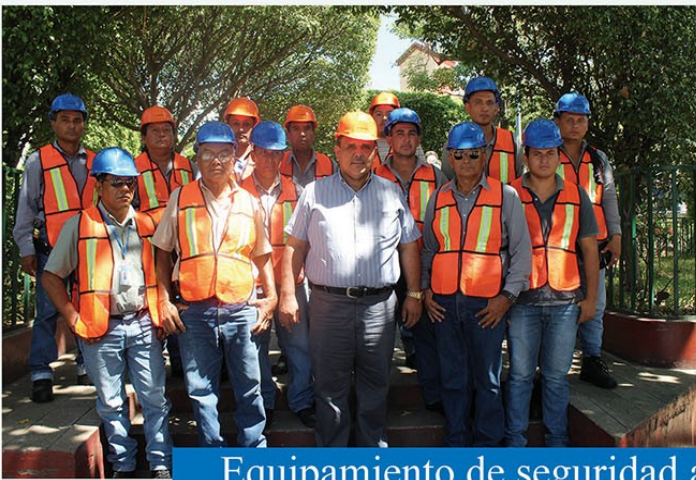
Equipamiento de seguridad a todo el equipo de Maquinaria