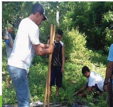
Area verde Com. Llano Grande # 1 y cuenta Río Caliente