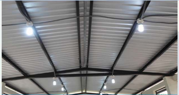
Casa Comunal San Fernando Área Urbana