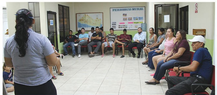
Elección de Juntas Directivas de los cinco Barrios del Sector Pueblo