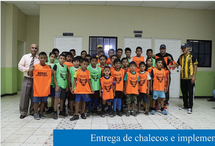
Entrega de chalecos e implementos deportivos a escuelita de fútbol