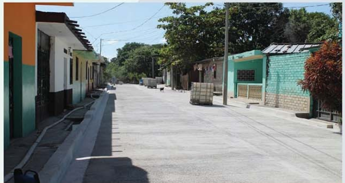
Concreteado de pasaje en Colonia San Lorenzo