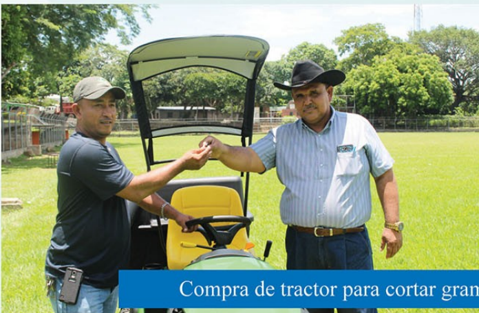
Compra de tractor para cortar grama en complejo deportivo de Tecoluca