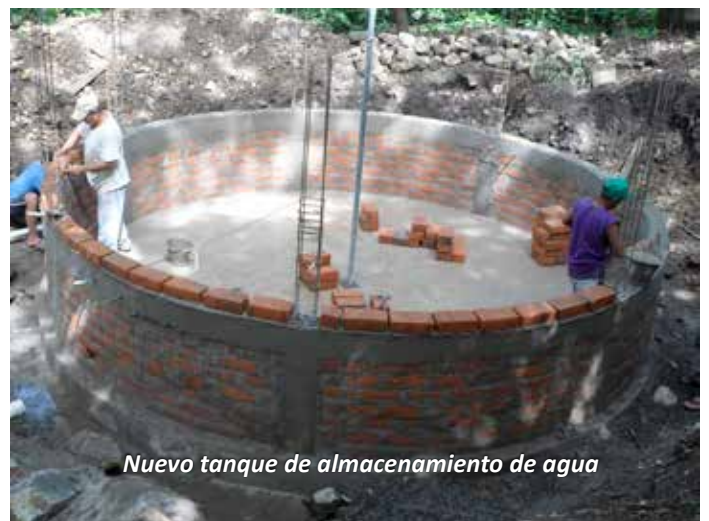
Nuevo tanque de almacenamiento de agua