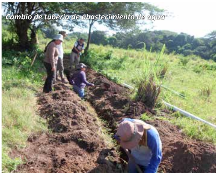
Cambio de tubería de abastecimiento de agua

Cooperación: Ayuda Obrera Suiza (AOS) / Alcaldía de Tecoluca