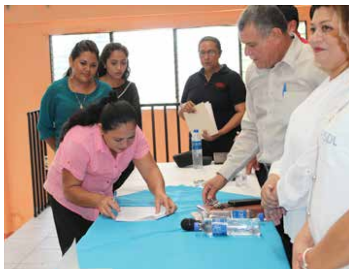
Firma de convenio