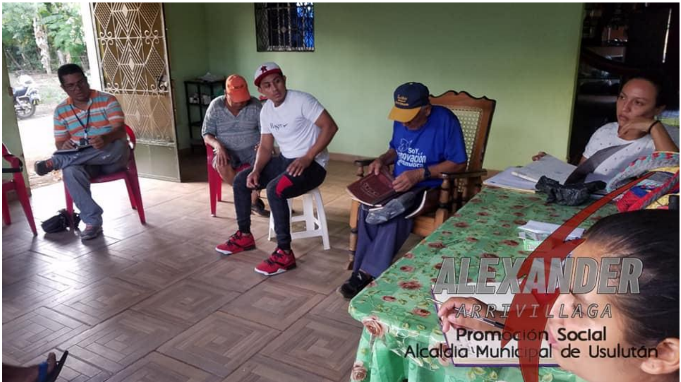
Reunión con directivos