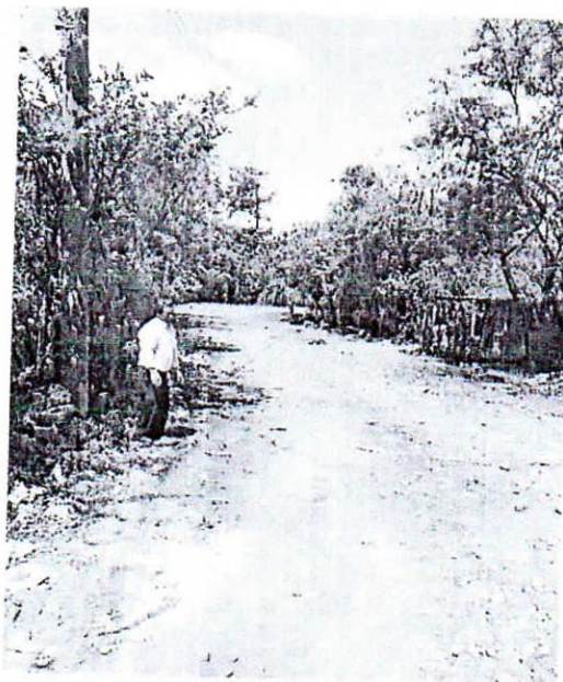
Estado de calles a reparar, requieren mantenimiento