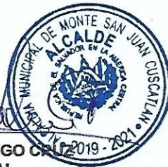
JESUS MORALES SINDICO MUNICIPAL