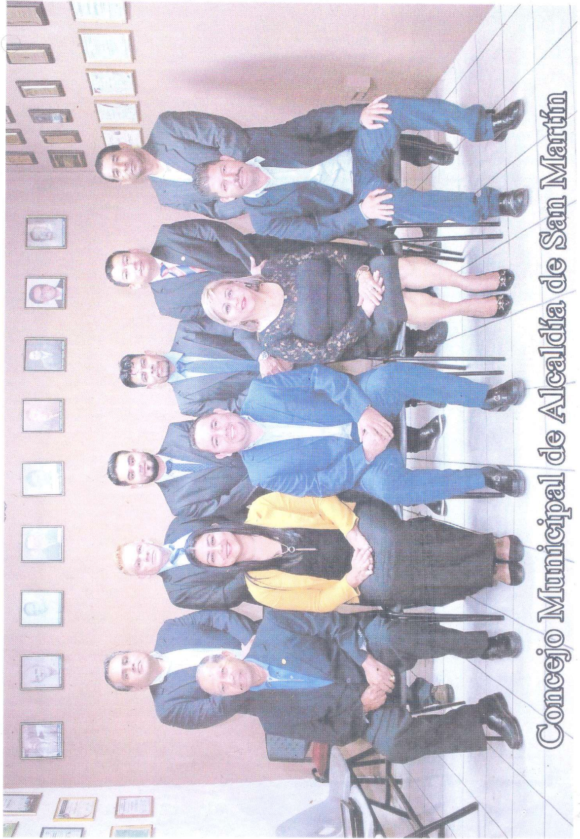
Concejo Municipal de Alcaldía de San Martín