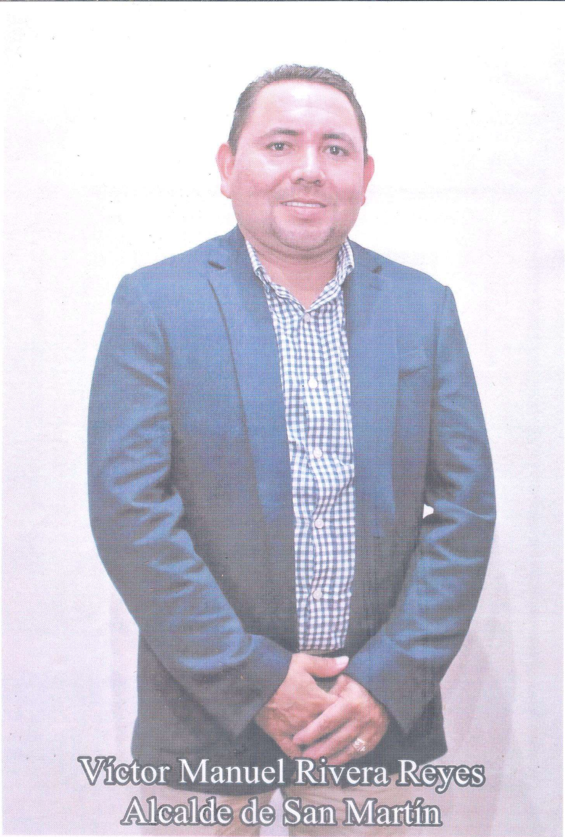
Víctor Manuel Rivera Reyes Alcalde de San Martín