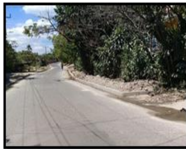
CANTON LAS DELICIAS