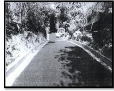
CANTON EL ROSARIO