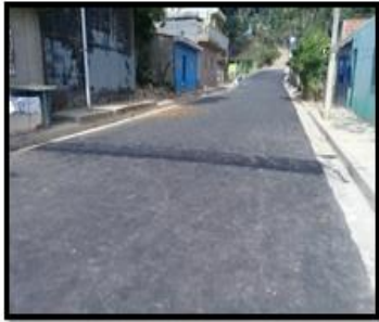
COL. SANTA MARIA