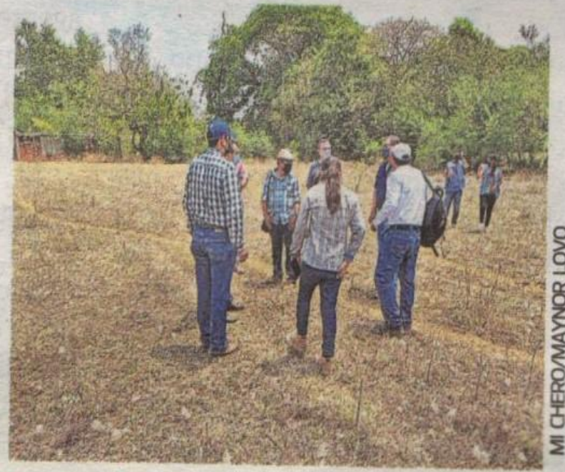
MI CHERO/MAYNOR LOVO

Tras el trámite, la directiva de la institución educativa evaluará la donación del terreno. La alcaldía espera que en los próximos días la institución educativa les informe la decisión.