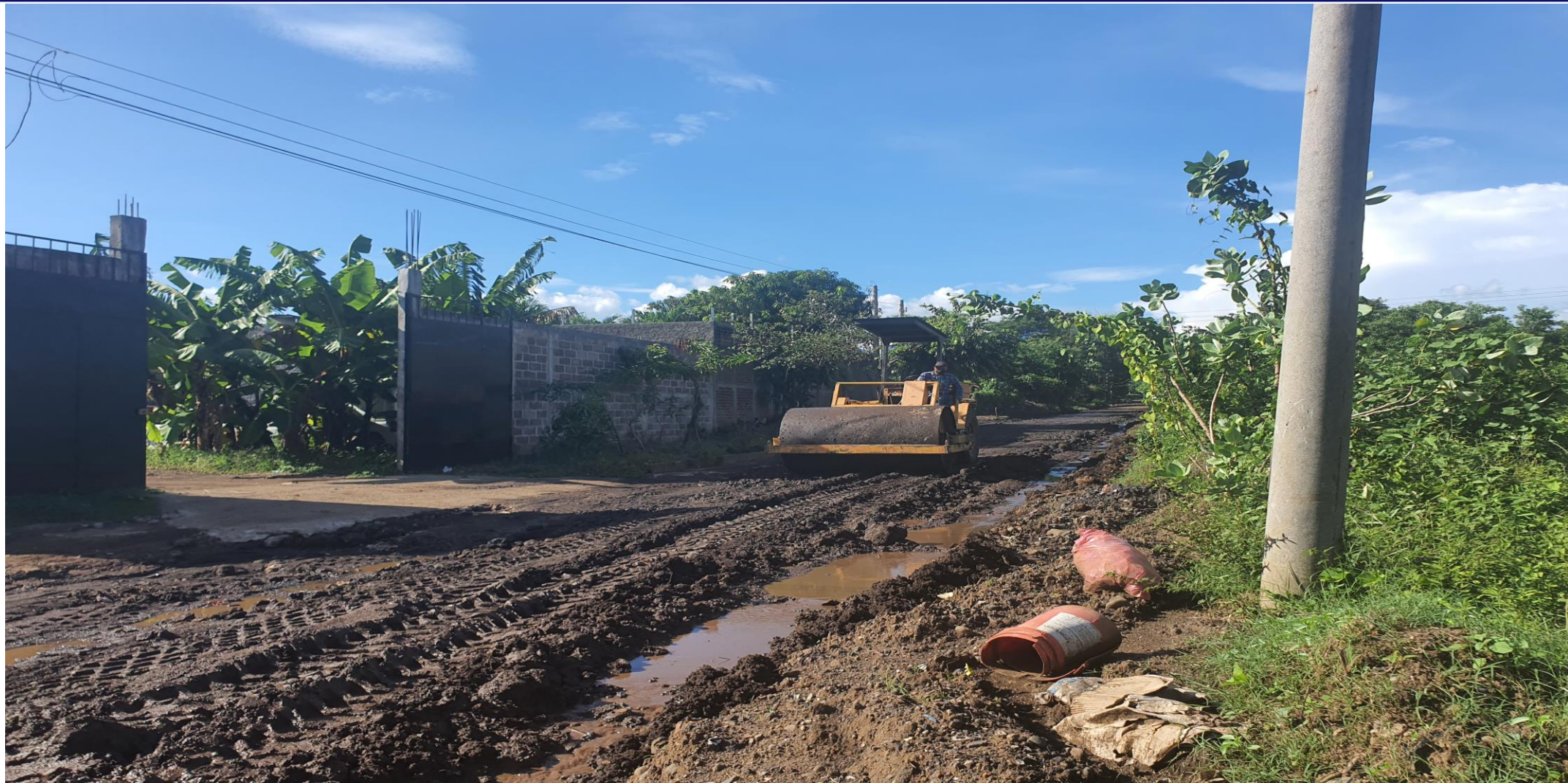
COLONIA JARDINES DE LA CONSTANCIA