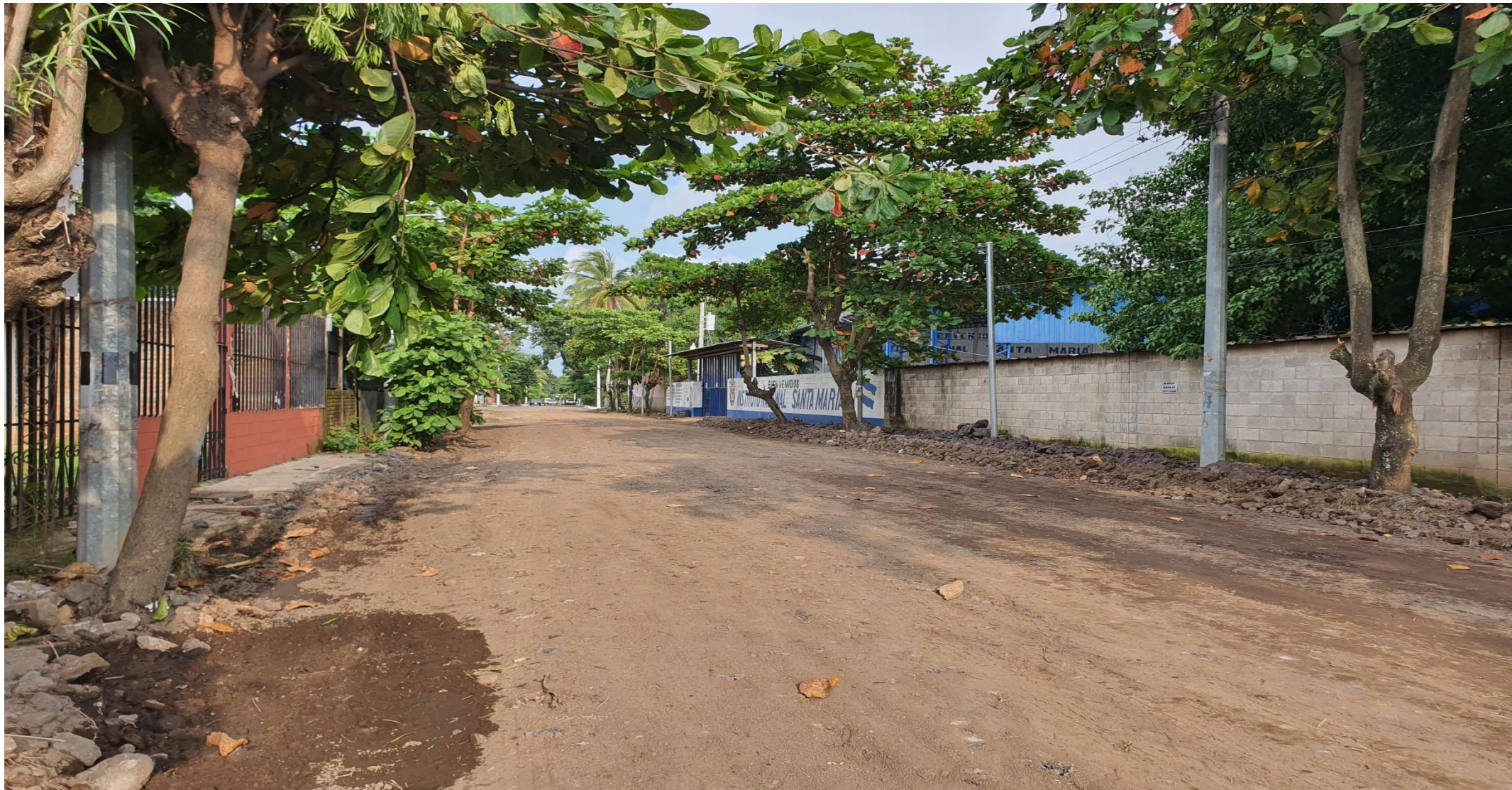
COLONIA SANTA TERESA