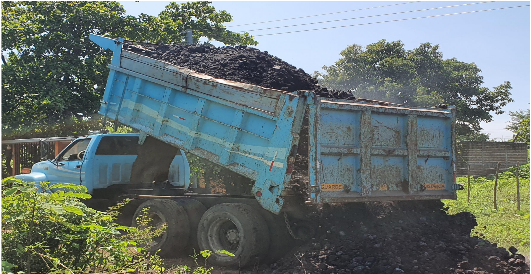
SUMINISTRO DE MATERIALES