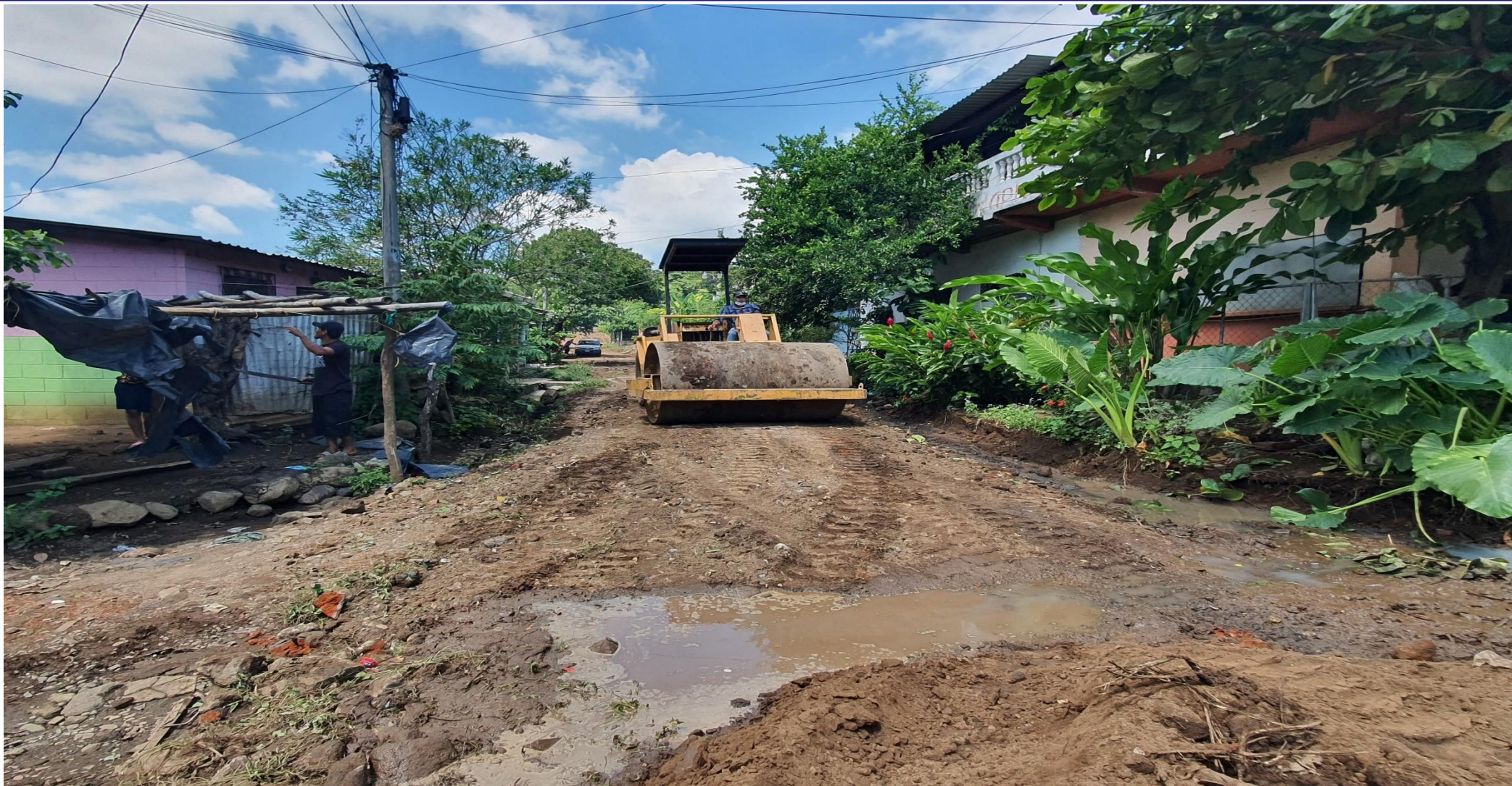
COLONIA JARDINES DEL EDEN