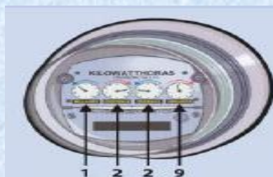
Si esta fuera tu última lectura registrada

EL RESULTADO DE TU LECTURA ES: 1257 KILOWATTS/HORA