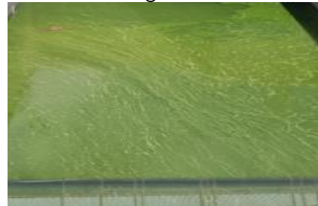
Agua con el problema de Algas

Por lo que después de haber finalizado el recorrido en la Planta Potabilizadora Las Pavas y realizar las evaluaciones técnicas, proporcionan opinión en base a su experiencia y conocimiento en la materia, en el sentido de recomendar que la mejor forma de controlar los afloramientos de algas es con la aplicación de SULFATO DE COBRE PENTAHIDRATADO y que los problemas de olor y sabor en el agua potable se controlan con CARBÓN ACTIVADO, las dosis propuestas fueron 4 mg/l para el SULFATO DE COBRE PENTAHIDRATADO y 2 mg/l para el CARBÓN ACTIVADO, sin embargo, recomiendan se realicen las pruebas respectivas; es importante recalcar que el problema suscitado con el agua servida es de tipo organoléptico y si bien es cierto el olor y sabor del agua produce desconfianza, se estima que al no tener conocimiento sobre la sustancia y su concentración es un tema que se tiene que tratar de manera expedita y oportuna.