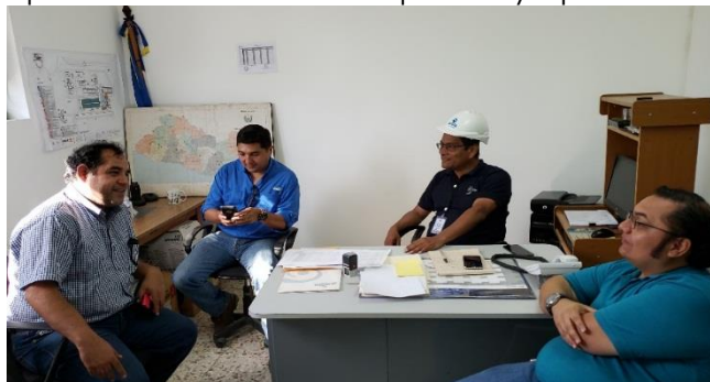
Técnicos de EMPAGUA en reunión de trabajo con Encargado de la Planta Potabilizadora Las Pavas

Por lo que después de haber finalizado el recorrido en la Planta Potabilizadora Las Pavas y realizar las evaluaciones técnicas, proporcionan opinión en base a su experiencia y conocimiento en la materia, en el sentido de recomendar que la mejor forma de controlar los afloramientos de algas es con la aplicación de SULFATO DE COBRE PENTAHIDRATADO y que los problemas de olor y sabor en el agua potable se controlan con CARBÓN ACTIVADO, las dosis propuestas fueron 4 mg/l para el SULFATO DE COBRE PENTAHIDRATADO y 2 mg/l para el CARBÓN ACTIVADO, sin embargo, recomiendan se realicen las pruebas respectivas; es importante recalcar que el problema suscitado con el agua servida es de tipo organoléptico y si bien es cierto el olor y sabor del agua produce desconfianza, se estima que al no tener conocimiento sobre la sustancia y su concentración es un tema que se tiene que tratar de manera expedita y oportuna.