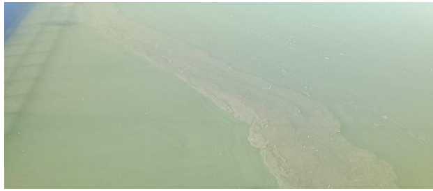
Traza de algas en el Río Lempa.

Río Lempa, dicho fenómeno natural fue ocasionado por las condiciones climáticas, la luz solar y la presencia de nutrientes en el agua.