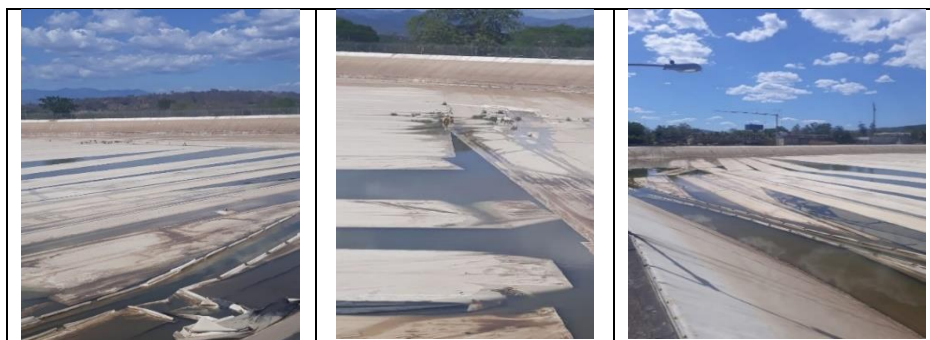
Toldo de Reservorio durante la intervención

En conclusión, el cierre total del reservorio de agua debido a los trabajos de reparación, han reducido significativamente la capacidad de servicio de la Planta Potabilizadora.