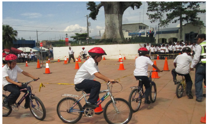
Festival Seguridad Vial en el Marco PREVES Santiago Texacuangos San Salvador.