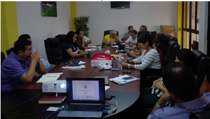
Comité Municipal de Prevención de la Violencia Aguilares

Apoyo y seguimiento a organizaciones comunitarias con participación ciudadana con el involucramiento del sector empresarial. A la fecha se cuenta con la participación de 25 representantes del sector empresarial en los 120 CMPV, así como 460 eventos para la organización, fortalecimiento y seguimiento a ADESCOS, directivas comunitarias, juntas vecinales, u otras organizaciones comunitarias en materia de prevención social de la violencia, brindando capacitación y asistencia técnica a los CMPV, capacitando a líderes comunitarios, realizando asambleas, así como también en el acompañamiento de actividades realizadas a través de los CMPV, todo esto beneficiando alrededor de 37,455 personas de diferentes municipios a nivel nacional.