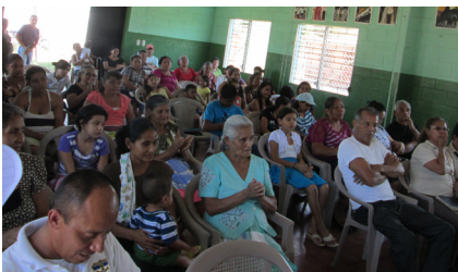
Asamblea Comunitaria Santa Ana

Apoyo y seguimiento a organizaciones comunitarias con participación ciudadana con el involucramiento del sector empresarial. A la fecha se cuenta con la participación de 25 representantes del sector empresarial en los 120 CMPV, así como 460 eventos para la organización, fortalecimiento y seguimiento a ADESCOS, directivas comunitarias, juntas vecinales, u otras organizaciones comunitarias en materia de prevención social de la violencia, brindando capacitación y asistencia técnica a los CMPV, capacitando a líderes comunitarios, realizando asambleas, así como también en el acompañamiento de actividades realizadas a través de los CMPV, todo esto beneficiando alrededor de 37,455 personas de diferentes municipios a nivel nacional.