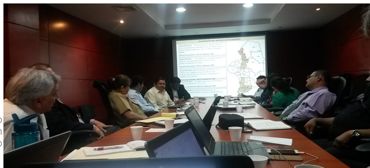
Comité Técnico del CNSCC definiendo estrategia de intervención con Alcalde de Ciudad Delgado

Con el propósito de minimizar la violencia en todas sus dimensiones, a través de la coordinación y articulación de esfuerzos entre el Gobierno Nacional, Gabinetes de Gestión Departamental y Gobierno Locales, así como con los organismos de cooperación internacional, entidades privadas y organizaciones de la sociedad civil, por medio de la Participación y seguimiento a los Gabinetes de Gestión Departamentales se han beneficiado alrededor de 8,172 personas de diferentes municipios a nivel nacional.