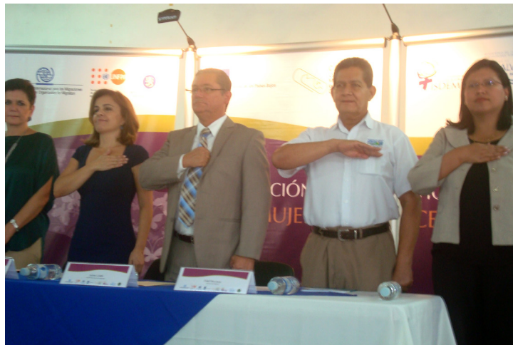
Lanzamiento BA1- Soyapango

UNFPA y OIM fungen como administradoras de los fondos. Este proyecto se encuentra actualmente en ejecución contribuyendo a la reducción de la violencia contra las mujeres, incluyendo las manifestaciones extremas de dicha violencia: la trata de mujeres y el feminicidio, a través de intervenciones sobre los factores que la propician.