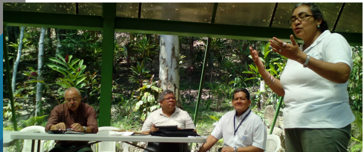
Presentación PATI municipio San Salvador

Considerando los niveles de inseguridad y delincuencia registrados en el país y el interés del Gobierno de El Salvador para sumar esfuerzos en la lucha contra este fenómeno social, se propone que en la 7ª convocatoria del PATI, se prioricen los municipios más afectados por la inseguridad y delincuencia, desde un enfoque de la prevención primaria en el ámbito comunitario. Dentro de este programa se invertirán $2,940,000,00.