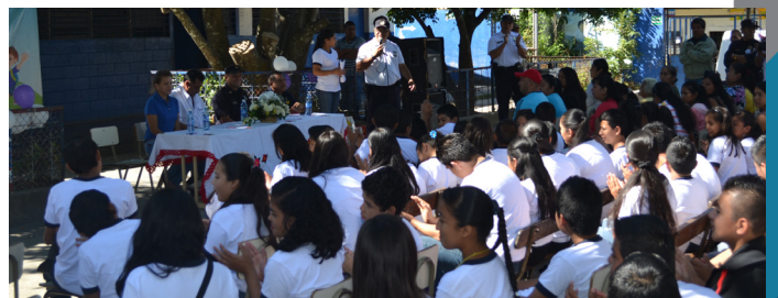
Escuelas Preventivas de Verano /San Pedro Perulapán Cuscatlán.

En base a la Estrategia Nacional de Prevención de la Violencia y en correlación con el Plan Nacional de Prevención y Seguridad en la Escuelas, el MJSP a través de la Dirección General de PREPAZ junto con la Unidad de la Policía Comunitaria y la Dirección Nacional de Gestión Departamental del Ministerio de Educación se desarrollaron los "Corredores escolares seguros – Escuela de Verano 2014". En el que se realizaron conjuntamente acciones de prevención desde actividades deportivas, lúdicas, primeros auxilios, cultura de paz, convivencia, corresponsabilidad ciudadana etc.