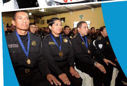
Fortalecimiento del control interno