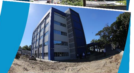
Inversión en la infraestructura