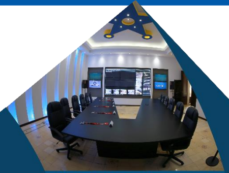
Modernización en sistemas y uso de tecnología