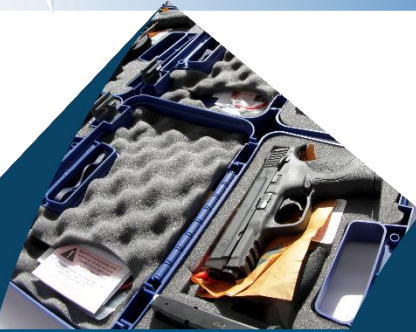
Modernización en equipo para el fortalecimiento de la operatividad policial por un monto de $10,259,028.07