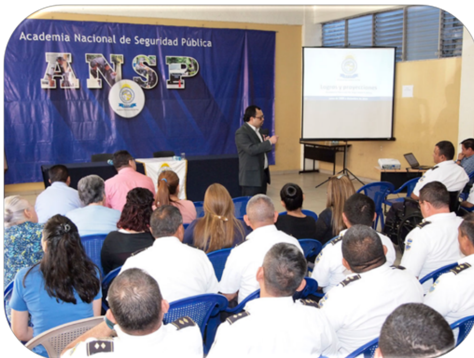
El día 17 de enero participaron 100 empleados y 60 policías que actualmente realizan el curso de ascenso a Inspector Jefe