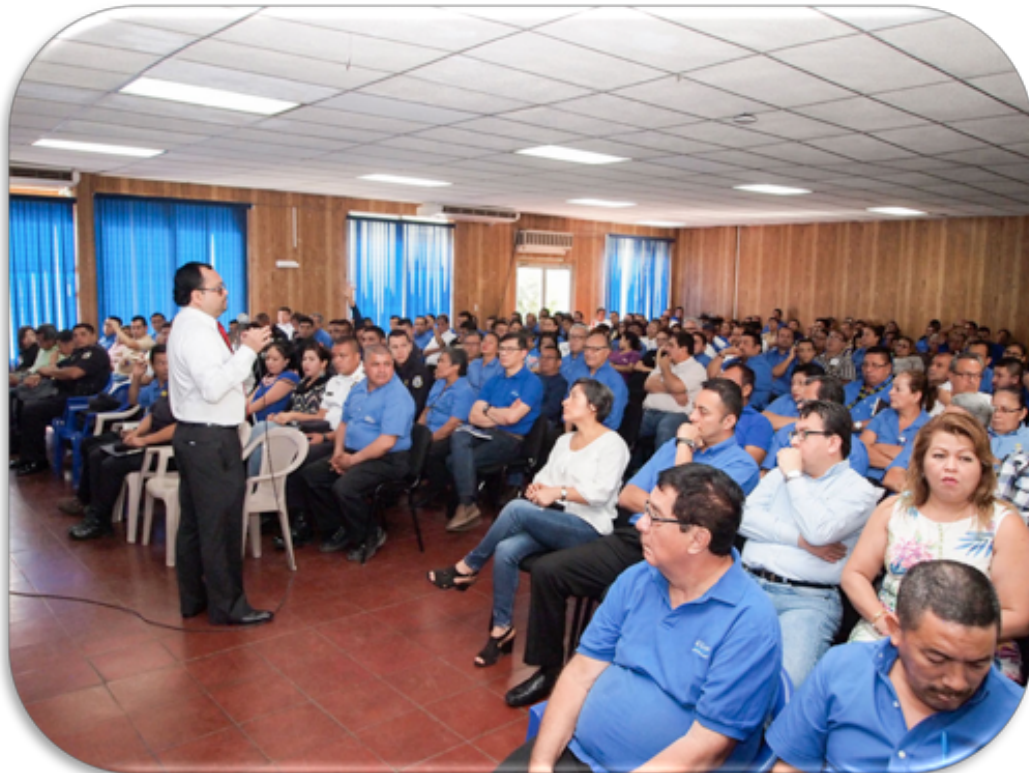
El día 15 de enero participaron 350 empleados y personal policial