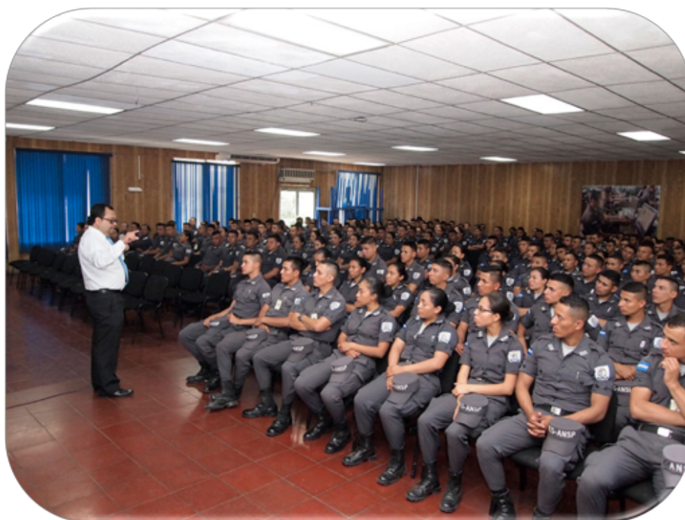
El día 21 de enero participaron 271 estudiantes de la Promoción 119