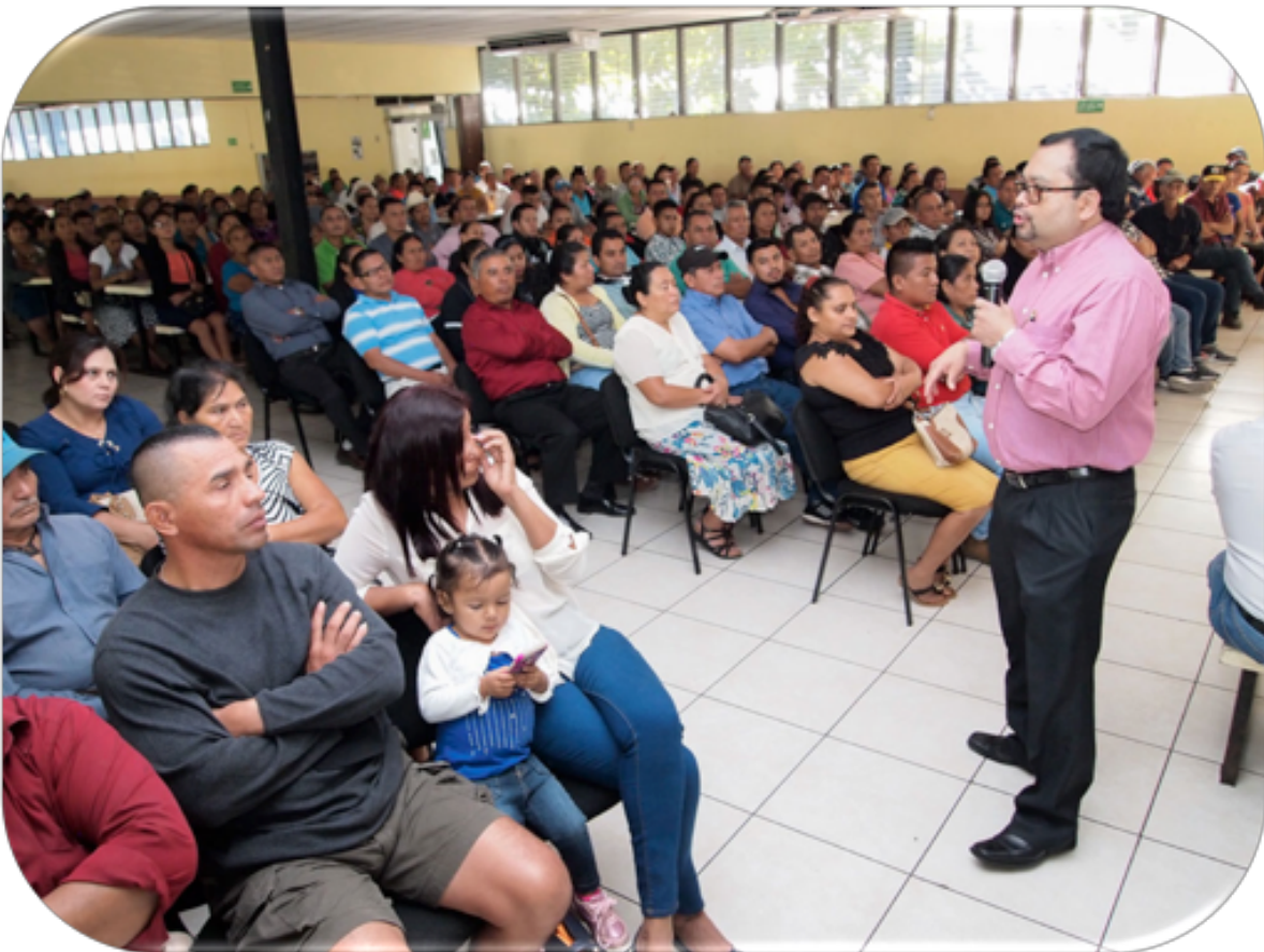
El día 14 de enero asistieron 417 familiares de estudiantes de la Promoción 121

Se capacitarán 4,400 policías en cursos de actualización y especialidades , con énfasis en investigación e inteligencia policial (sujeto a aprobación de refuerzo presupuestario).