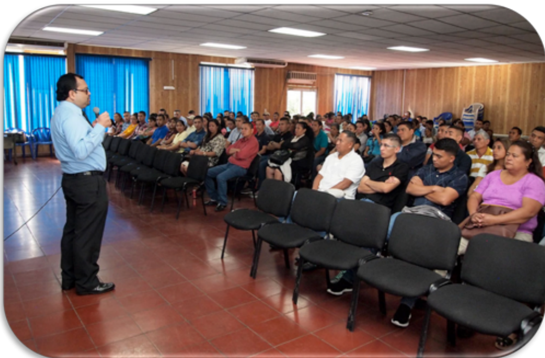
El día 24 de enero asistieron 95 estudiantes y 105 familiares de los departamentos de Ahuachapán, Sonsonate y Santa Ana