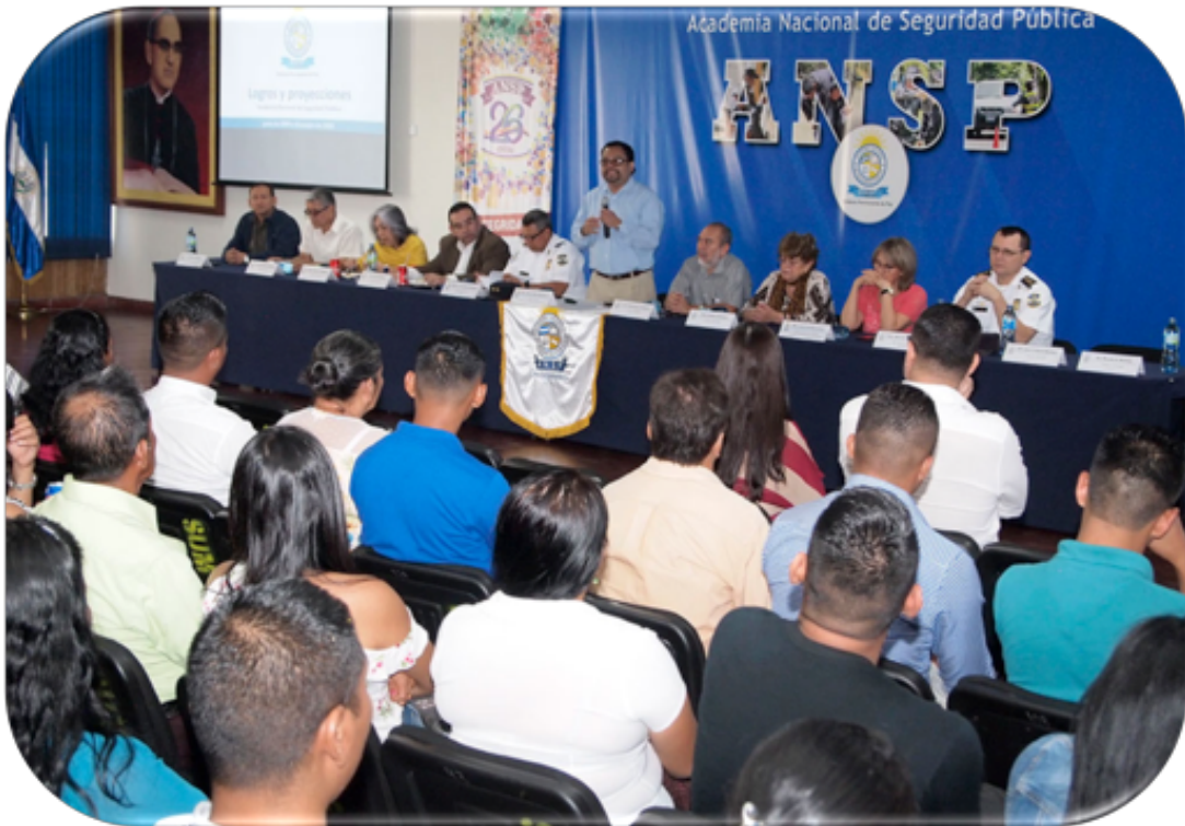
El día 25 de enero asistieron 89 estudiantes y 114 familiares de los departamentos de Chalatenango, La Libertad, San Salvador, Cabañas, Cuscatlán y La Paz