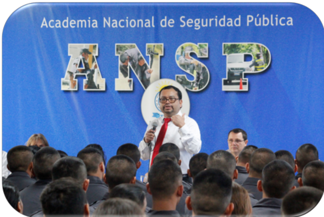
El día 15 de enero recibieron la jornada 292 estudiantes de la Promoción 121