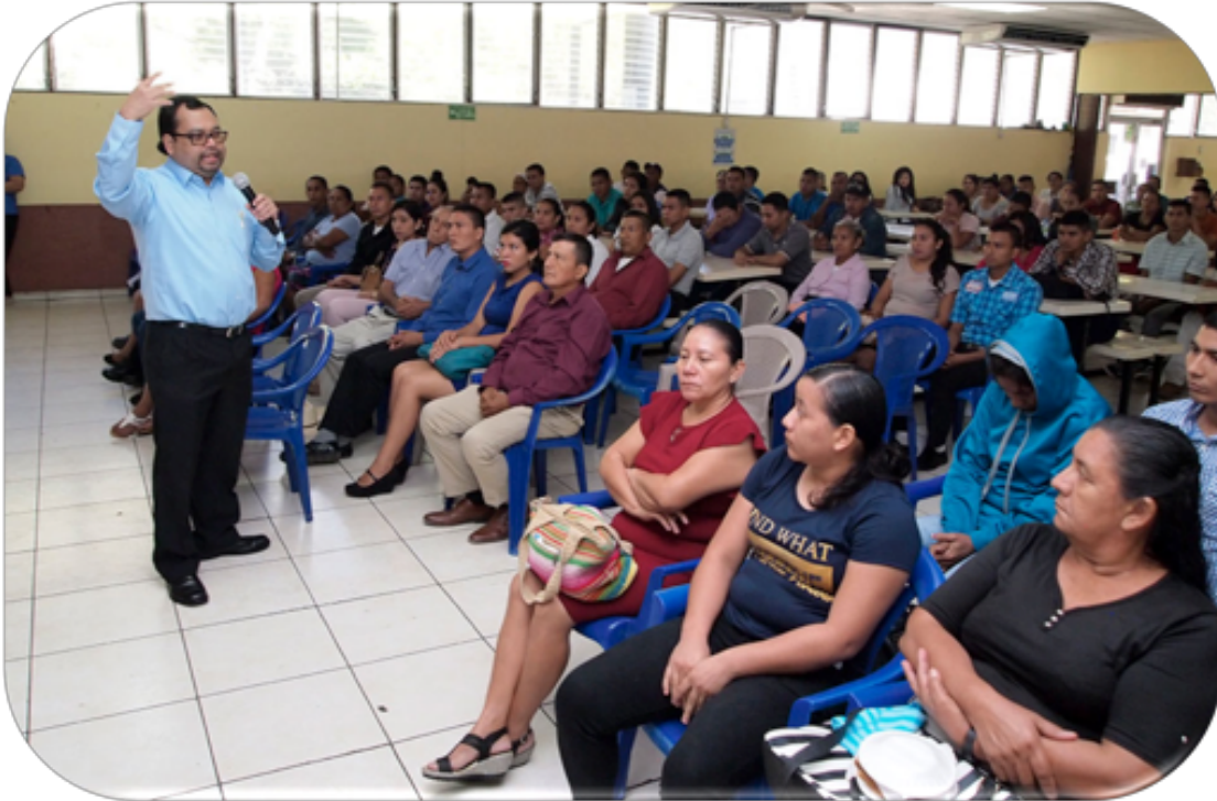
El 29 de enero asistieron 91 estudiantes y 115 familiares de los departamentos de La Paz, San Vicente, San Miguel, Usulután, Morazán y La Unión