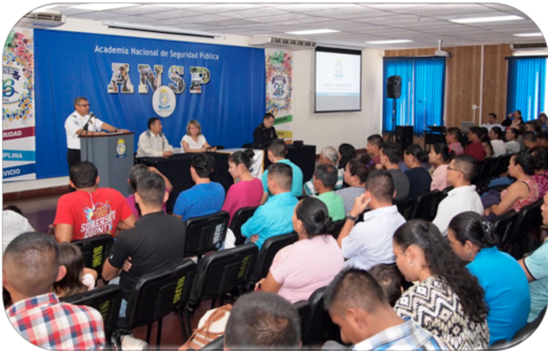
El día 23 de enero asistieron 90 estudiantes y 192 familiares del departamento de Ahuachapán