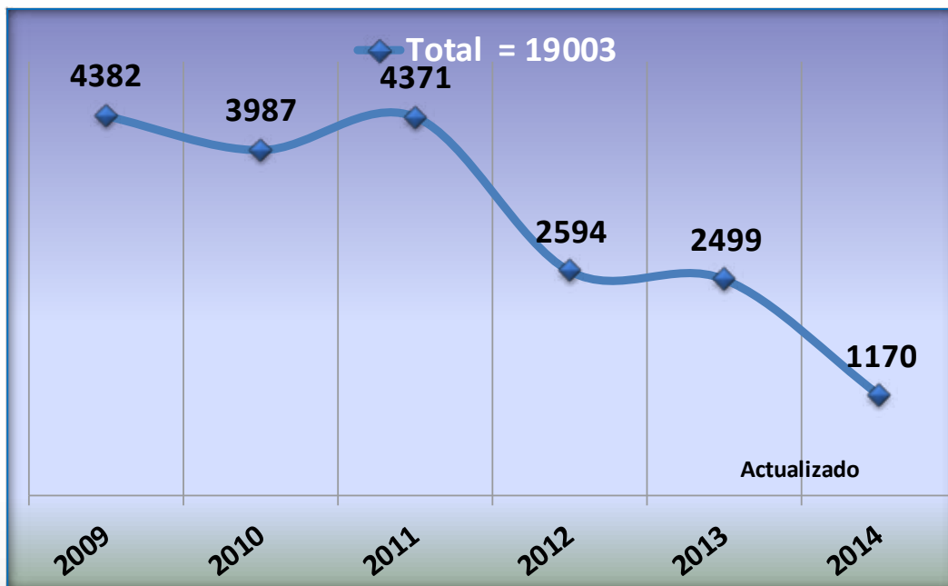
TENDENCIAS DE HOMICIDIOS DEL 2009 - ABRIL 2014