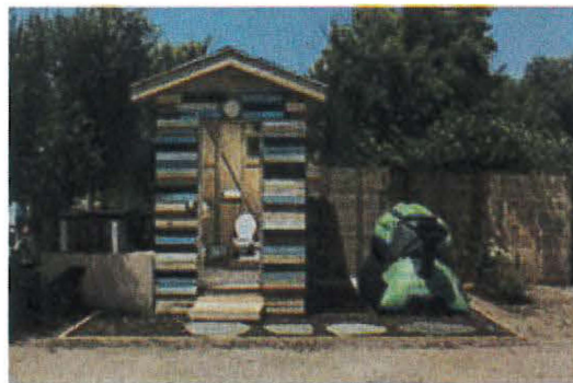
Inodoro de bajo consumo (figura ilustrativa).