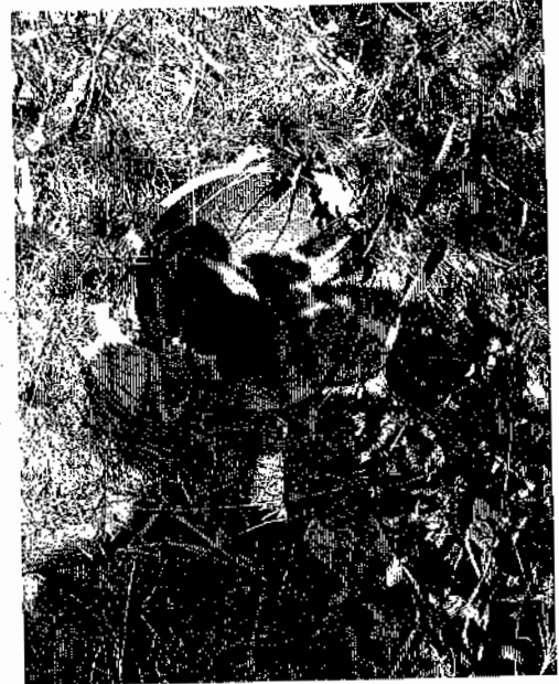
Figura 2. Proyecto de exploración iniciado