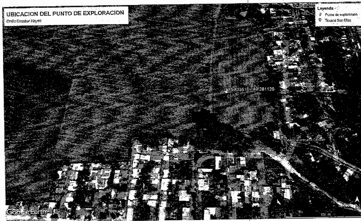
Figura 1. Mapa de ubicación para la exploración

Calle La Reforma # 219 Colonia San Benito, San Salvador, El Salvador, Centro América.