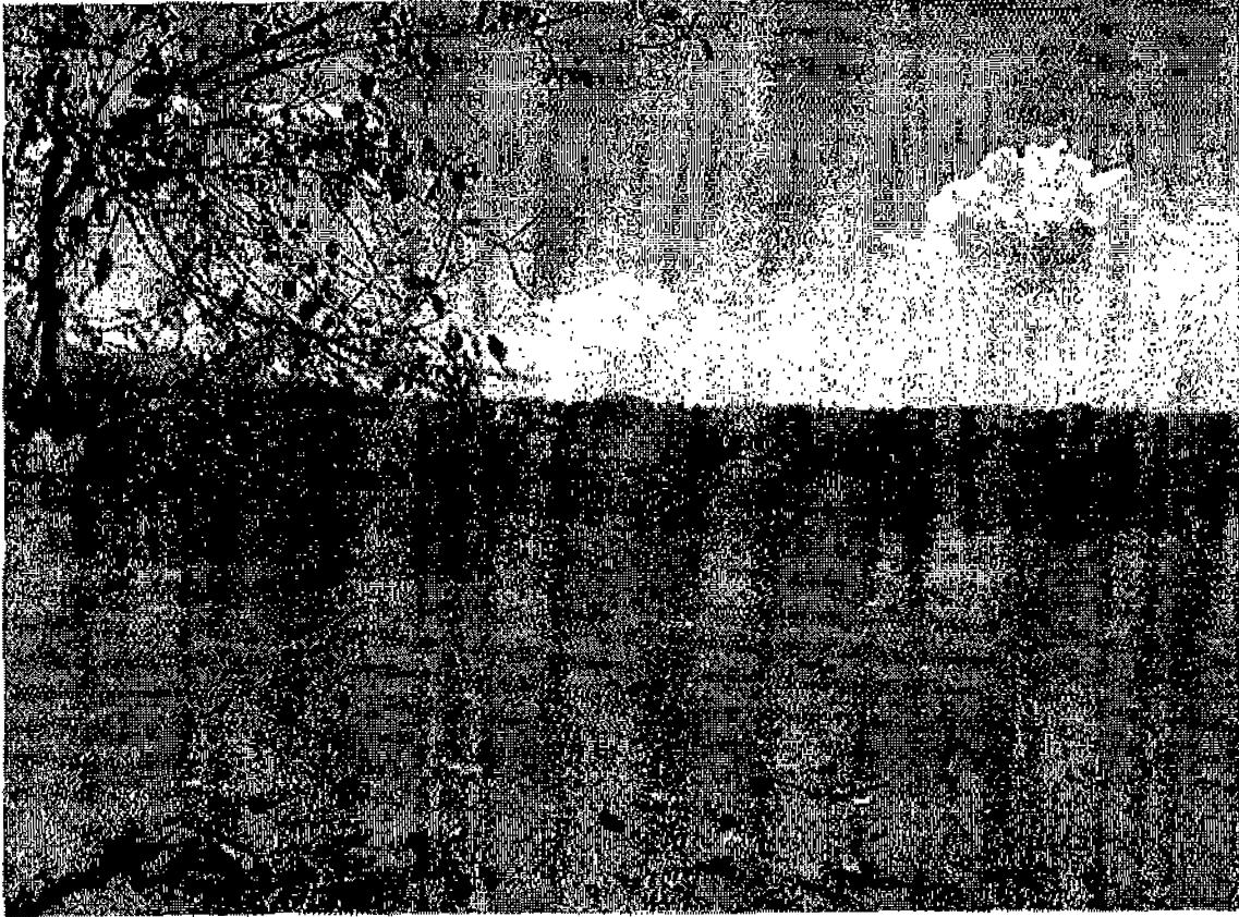
Fotografía 2. Condiciones de la zona

Calle La Reforma # 219 Colonia San Benito, San Salvador, El Salvador, Centro América.