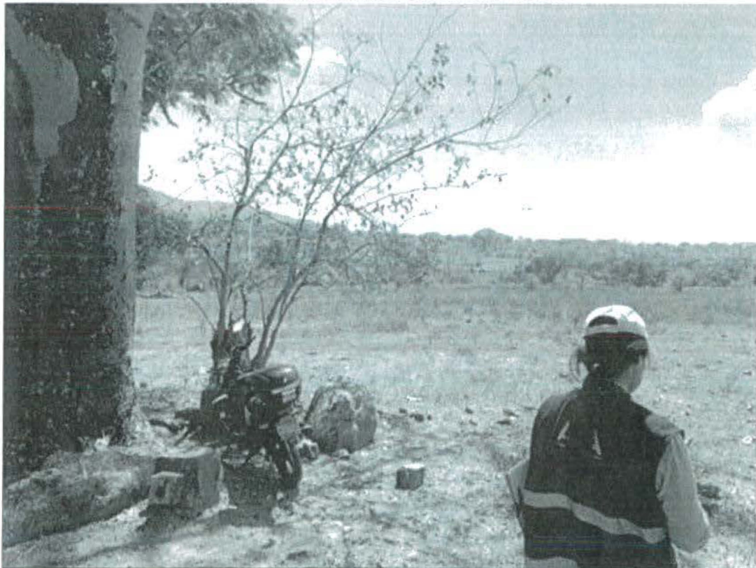
Fotografía 1. Condiciones del punto de exploración.

Calle La Reforma # 219 Colonia San Benito, San Salvador, El Salvador, Centro América.