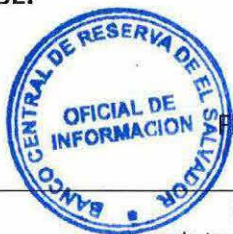
Por Idania Romero de Fernández Oficial de Información

POR TANTO: Esta oficina fundamentada en los Artículos 62, 64, 65 LAIP, así también con base a lo establecido en los Artículos 53, 54, 55 y 56 del Reglamento; RESUELVE: proporciónese la información requerida por en consecuencia ENTREGUESE a través de correo electrónico información relativa a "1) Valor agregado de la sección M "Actividades profesionales, científicas y técnicas" en función de CIU rev.4 para cada año del período 2004 – 2018, 2) Valor agregado de la sección M, división 72 "Investigación científica y desarrollo" en función de CIU rev.4 para cada año del periodo 2004 – 2018, 3) Valor agregado de la sección M, división 72, grupo 721, clase 7210 "Investigaciones y desarrollo experimental en el campo de las ciencias naturales y la ingeniería" en función de CIU rev.4 para cada año del período 2004– 2018". NOTIFIQUESE.