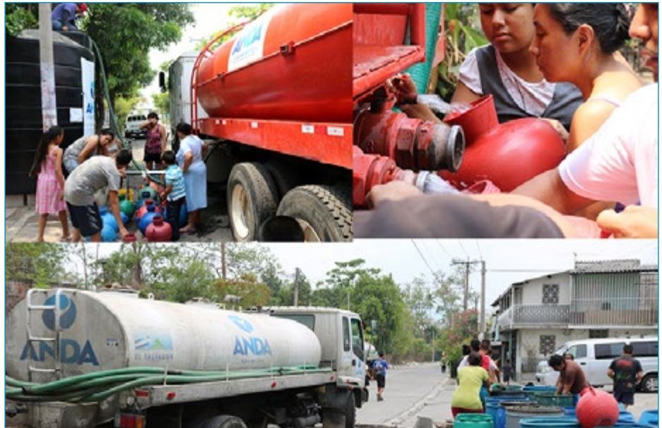
ANDA ha abastecido de agua a la población que no cuenta con este servicio.

El Secretario Hasbún agregó que la prioridad para el derecho al agua lo debe tener la población misma y que el país ha avanzado en este sentido y muestra de ello es una evaluación de la Universidad de Carolina del Norte sobre