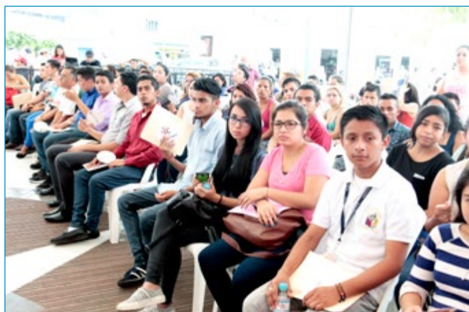
Posterior a la reunión, la delegación del CNSCC participó en el lanzamiento del programa Presidencial "JovenES con todo", en Ciudad Delgado, mediante el cual serán beneficiados 400 jóvenes. En total se invertirá $144 mil dólares en programa de pasantías laborales para jóvenes de este municipio.

los lugares más necesitados en los municipios del PESS a partir de los diagnósticos realizados por el CNSCC.