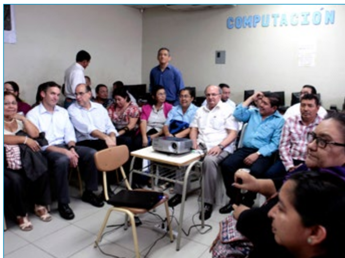
El recorrido de la comitiva en Ciudad Delgado finalizó en la escuela Juana López, una de las 11 priorizadas en la zona, donde se verificaron los avances así como también de las necesidades de recursos del Centro Educativo.