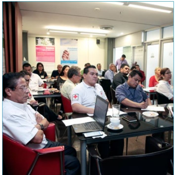
La mesa de Saneamiento Ambiental reúne a diferentes sectores afines a esta temática.