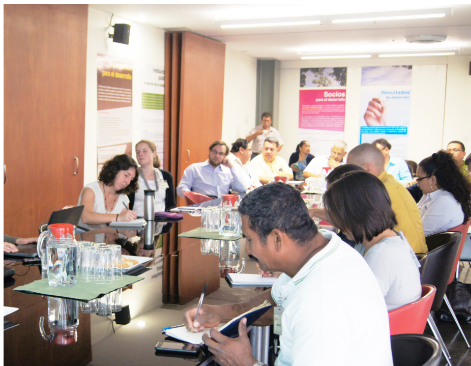
• La mesa de Recuperación del río Acelhuate analiza áreas preliminares de trabajo, para ejecutar acciones de rescate del afluente.

Agregó que también es importante el involucramiento de los acto-