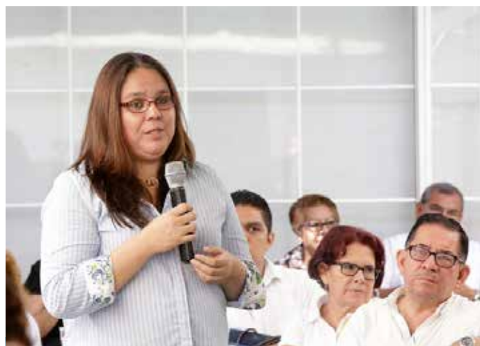
En el encuentro participaron beneficiados del Plan El Salvador Educado, quienes dieron a conocer su experiencia en la implementación de este plan de país.

“Un trabajo impresionante para cumplir estos desafíos, que son realmente desafíos históricos de la sociedad salvadoreña”, expresó el funcionario, al tiempo que criticó que la educación no ha sido históricamente una prioridad del Estado salvadoreño.