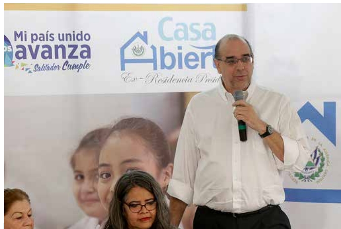
El Subsecretario Antonio Morales destacó en Casa Abierta el trabajo en conjunto de los diferentes actores en los territorios para implementar el PESE.

Mientras tanto, el ministro de Educación, Carlos Canjura, dijo que hacer realidad el Plan “significa un enorme trabajo territorial”.