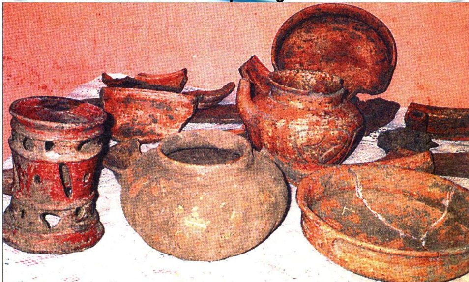
Piezas encontradas en el sitio arqueológico