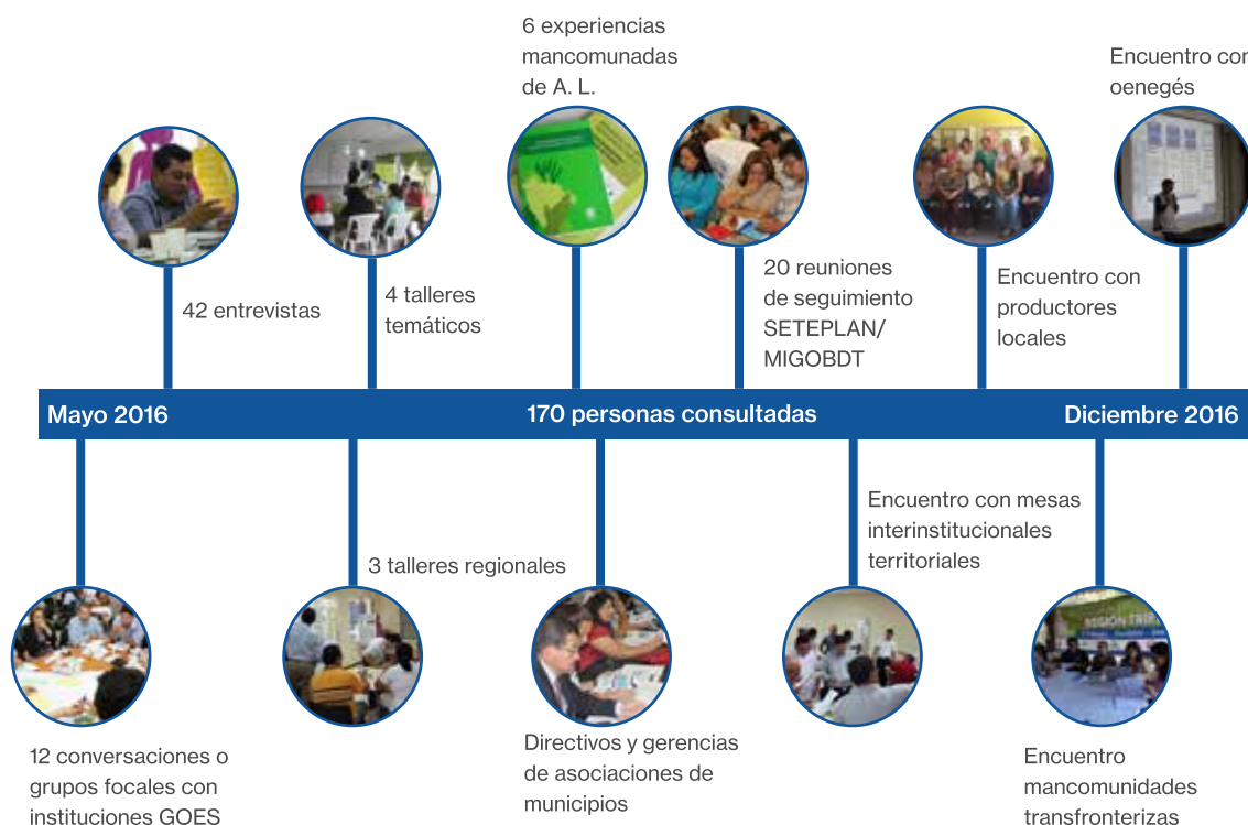
Gráfico No. 1 Proceso de Elaboración PNGAT

Las metodologías y las herramientas aplicadas en el proceso de consulta se distanciaron de ser rígidas, y se adaptaron a la diversidad de actores y espacios participativos con el afán de enriquecer la discusión, los aportes y los resultados.