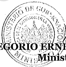
GREGORIO ERNESTO ZELAYANDIA CISNEROS, Ministro de Gobernación.