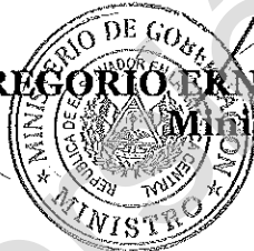
GREGORIO ERNESTO ZELAYANDIA CISNEROS, Ministro de Gobernación.