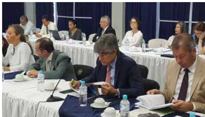
• El 30 de noviembre, el CNSCC conoció de manera preliminar los resultados de los talleres de evaluación de la implementación del Plan El Salvador Seguro (PESS).

De aumento en los cupos dentro de los centros de privación de libertad, gracias a la inversión en infraestructura realizada en el sistema penitenciario, lo cual reduce el alto nivel de hacinamiento que registra el país.