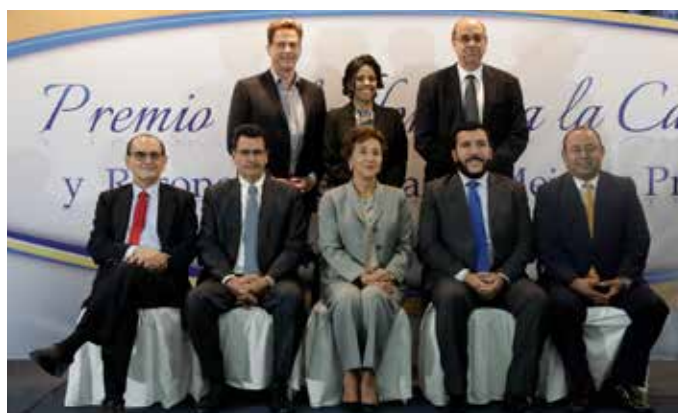
• Jurado del Premio Salvadoreño a la Calidad.

En esta ocasión, el jurado calificador declaró tres proyectos ganadores para el galardón