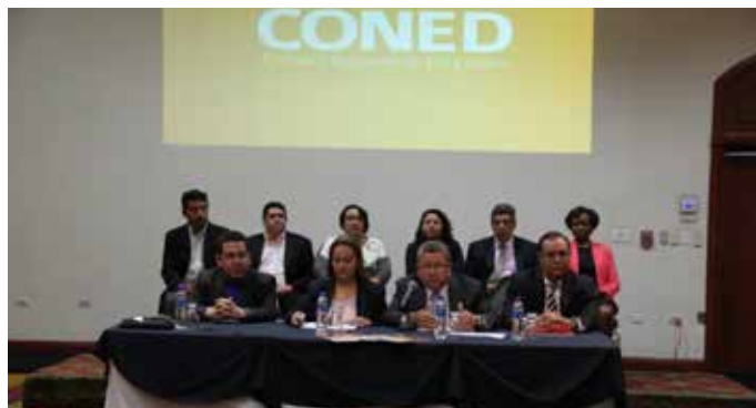
• El pasado 1 de diciembre miembros del CONED realizaron una conferencia de prensa para expresarse a favor de aumentar el financiamiento a la educación en El Salvador.

Niños de 0 a 3 años incorporados al programa de educación inicial.