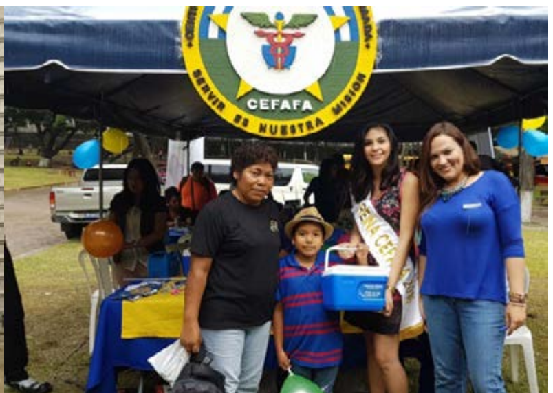
Presencia de marca CEFAFA.