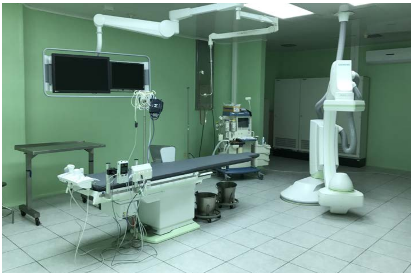
Angiógrafo donado al Hospital Militar Central, con un valor de $650,000.00

Donaciones por medio de Fondo de Apoyo al Programa de Rehabilitación.