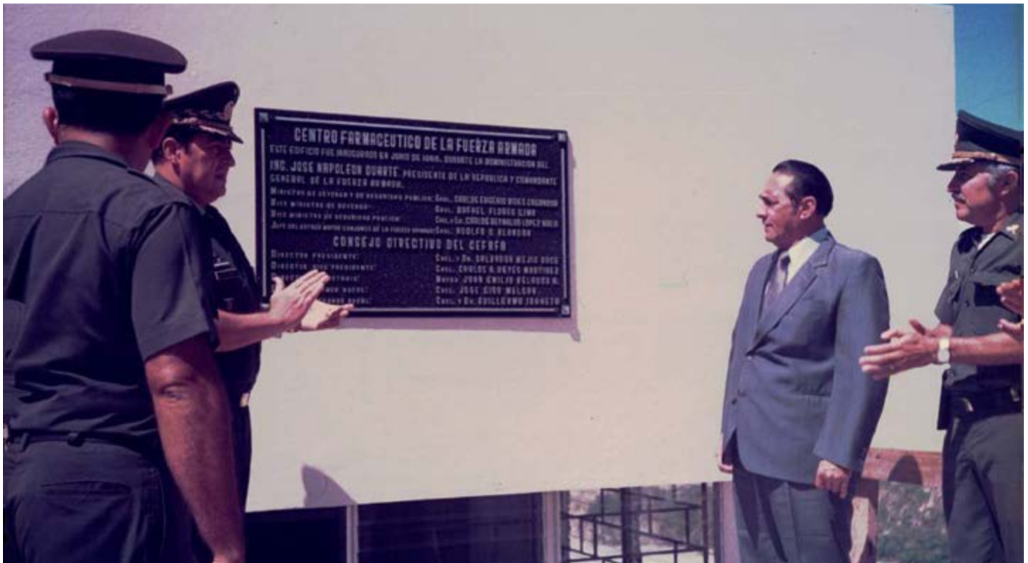
Puesta de la primera piedra en terreno donado para el CEFAFA.

El 16 de julio de 1968, se creó la Farmacia del Gobierno Salvadoreño, la cual fue identificada con sus siglas "FAGS"; posteriormente, la FAGS amplió su oferta de mercadería, atendiendo la sugerencia de su nascente clientela, y fue así como incorporó a su sala de ventas el departamento de cosméticos, el cual empezó a funcionar a partir de diciembre de 1976. El desarrollo de la Farmacia se hizo más evidente a partir de septiembre de 1977 cuando se inauguró la primera sucursal en la Segunda Brigada de Infantería, en la ciudad de Santa Ana.