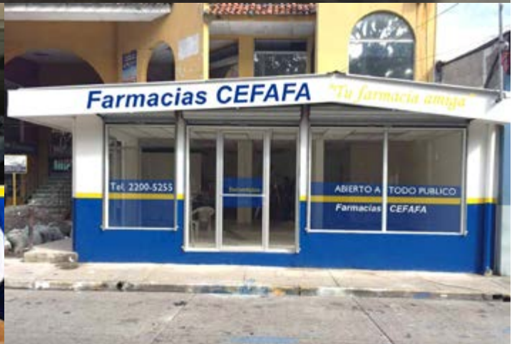
Aperturas y remodelaciones realizadas durante el período.